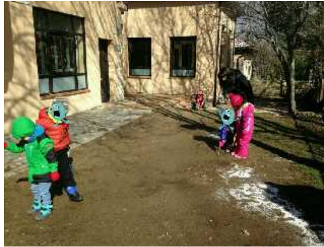
Sesión 1: Presentación