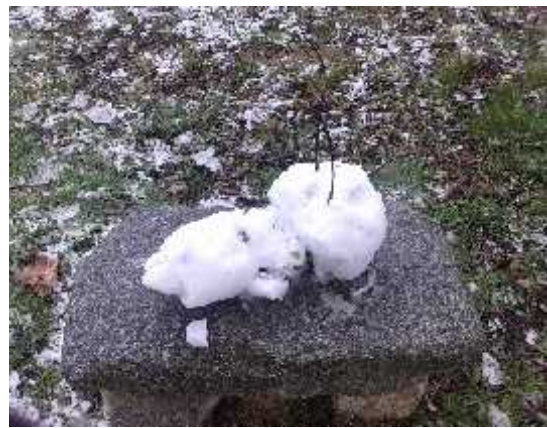
Adornos de hielo