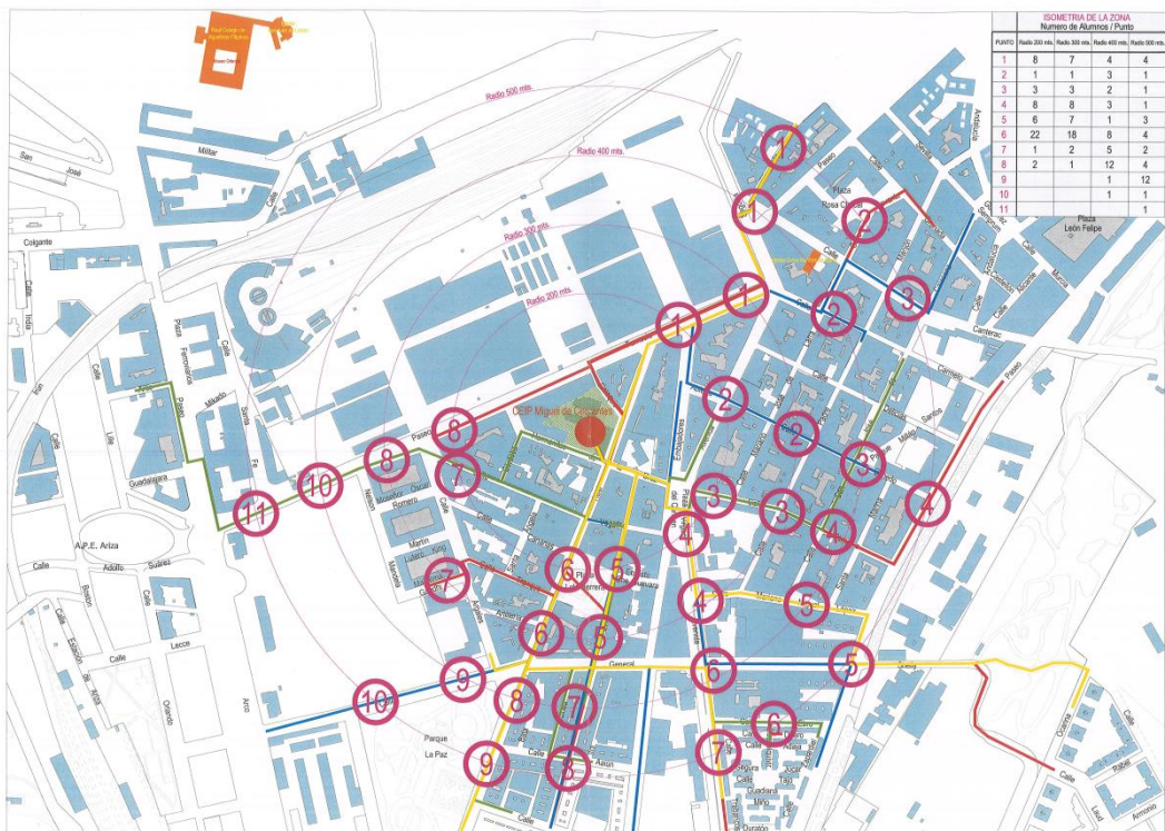
Figura 2. Plano CEIP Miguel de Cervantes y alrededores.