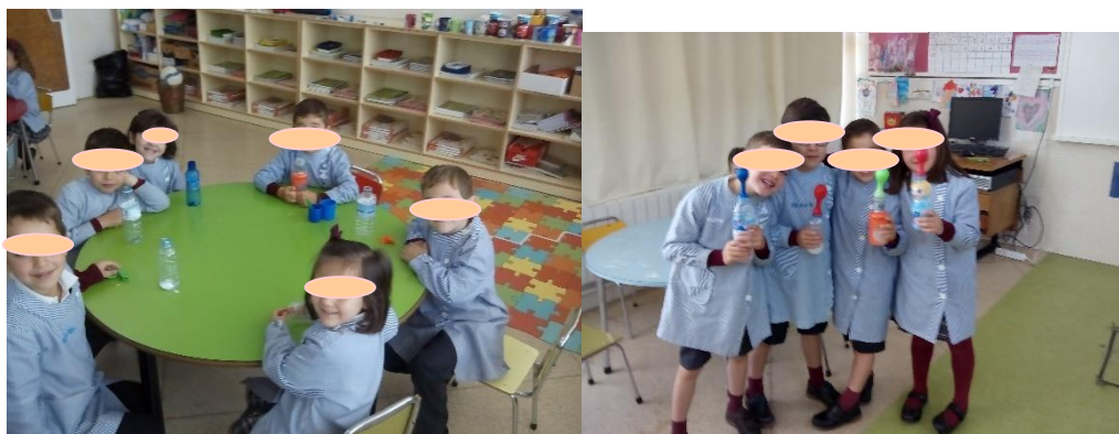
Figura 6 y 7.

Esta pregunta ha supuesto un nuevo aprendizaje, hemos podido comparar ambos experimentos y sus resultados, algo que no me había propuesto inicialmente en el diseño de la actividad.