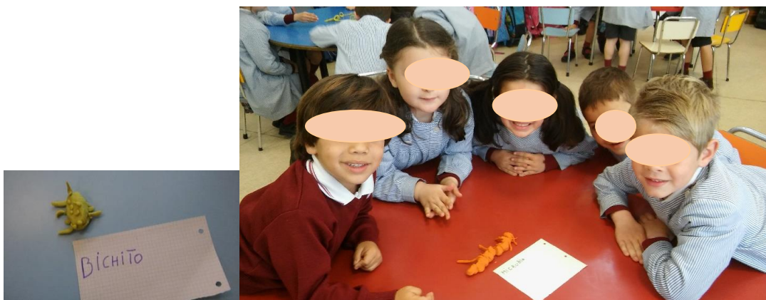
Figura 2 y 3.

En cuanto al trabajo en grupo, un aspecto que considero relevante en el proyecto porque caracteriza el proceso científico y me parece de especial interés fomentarlo a esta edad, en la que empiezan a desarrollarse los juegos en grupo junto a la asignación de roles en el mismo. En general, exceptuando un caso, los agrupamientos fueron los correctos porque funcionaron muy bien. Enseguida se pusieron de acuerdo, se distribuyeron tareas y empezaron a trabajar obteniendo un buen resultado; aunque no fueron muy creativos, todas las formas eran alargadas o redondeadas. Se consiguieron los contenidos que perseguía esta actividad, los niños ya tenían una idea válida sobre cómo podría ser un microbio.