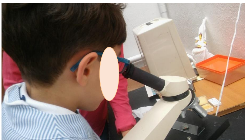
Figura 4 y 5.

Niños mientras observan microbios con microscopio