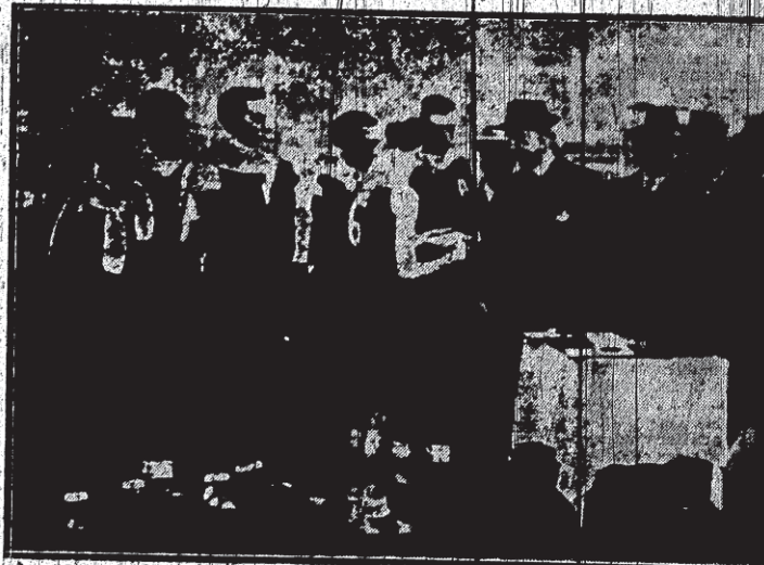
Festival en honor de los subcampeones de Europa de basket-ball. — Momento de la entrega a los jugadores que en Ginebra proclamaron subcampeones de Europa, de unas placas con medallas de oro e inscripciones conmemorativas de su triunfo