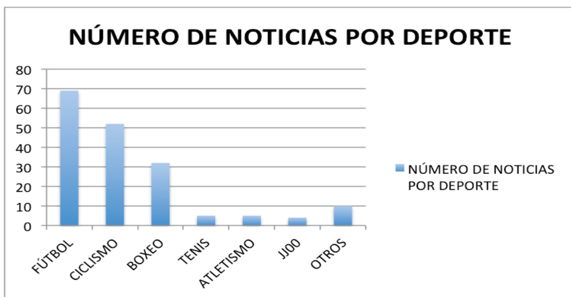
Figura 2. Número de noticias por deporte durante la Guerra Civil