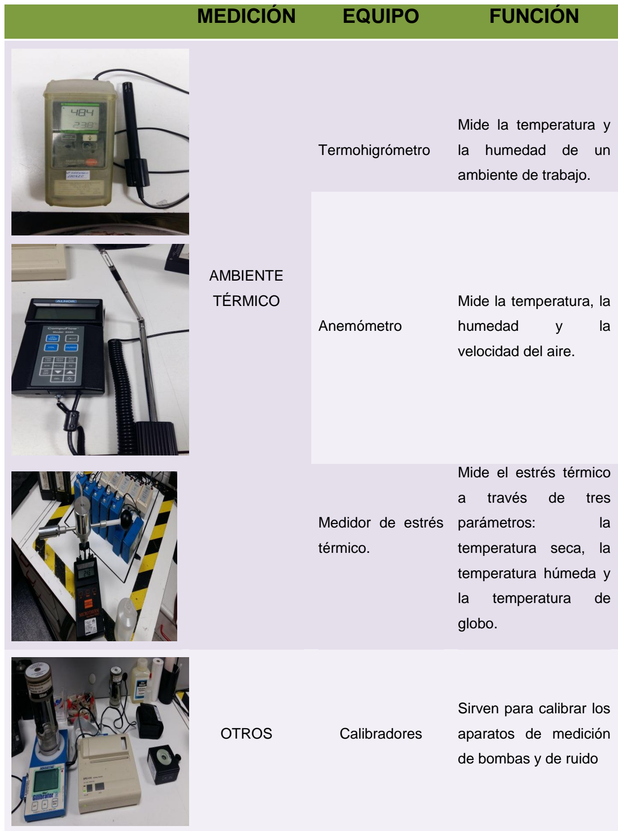
TABLA I. Identificación de equipos y funciones del laboratorio de Premap.