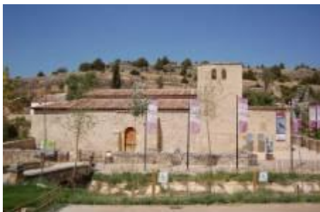
Figura 3.4. Casa del Águila Imperial

El centro es gestionado por la Fundación Patrimonio Natural. Consta de dos zonas: la Iglesia de San Miguel que constituye el centro temático y el jardín de San Miguel, un espacio adicional.