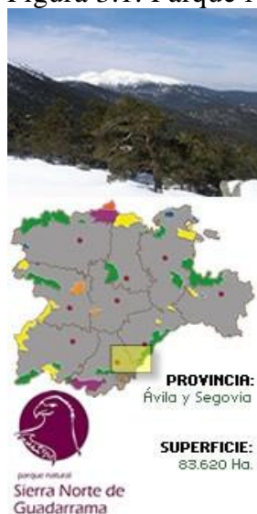
Figura 3.1. Parque Natural Sierra Norte de Guadarrama