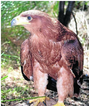
Figura 3.2. El Águila Imperial Ibérica

De: http://goo.gl/7RbNe1 28 de junio de 2016.