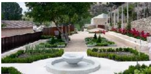
Figura 3.5. Jardín de San Miguel