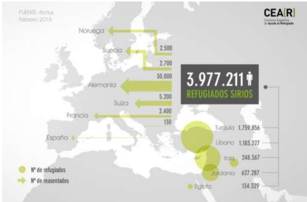
Imagen 1: Comisión de Ayuda al Refugiado (2014). Reasentamiento y admisión humanitaria de refugiados sirios en Europa.

La causa principal de esta gran oleada de refugiados, es la actual Guerra Civil de Siria, la cual fue producto de las tensiones político-sociales que estallaron en Siria dentro del contexto de la “Primavera Árabe” (7) .