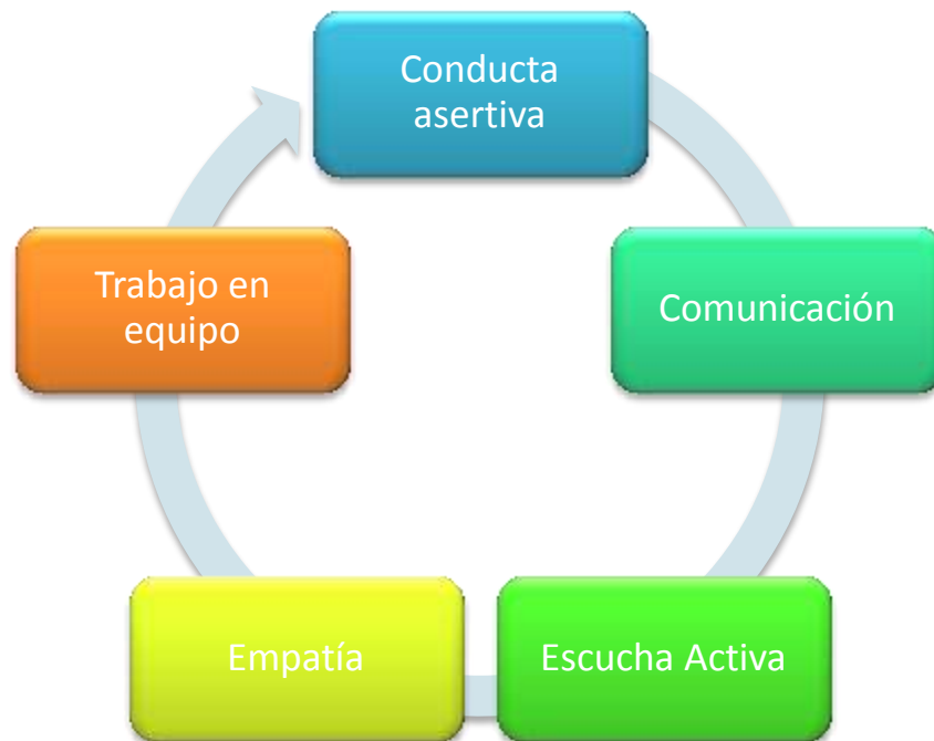
Figura 2. Elaboración propia