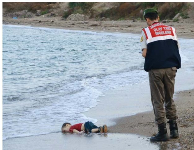
Imagen 1. Aylan Kurdi en la playa de Bodrum (Turquía)

Fuente: El Mundo . Publicado en la portada del día 3 de septiembre de 2015.