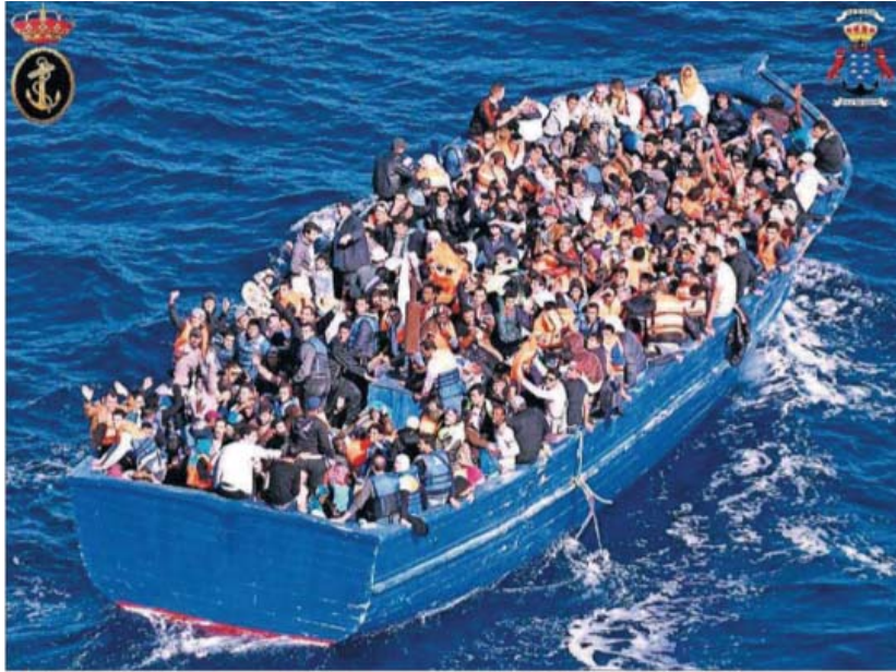
Imagen 3. Más de 500 personas rescatadas frente a Libia