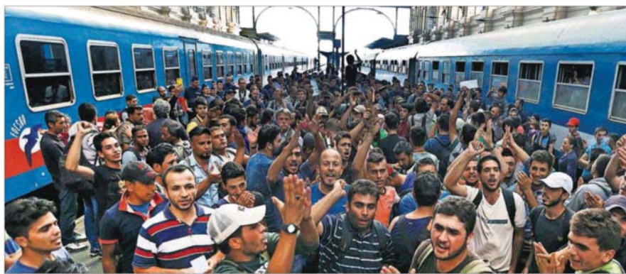
Decenas de refugiados protestan, ayer, en la estación de Budapest después de que las autoridades les hayan desalojado de un tren con destino a Alemania.