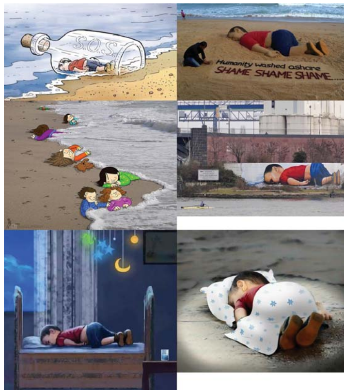
Imagen 2. Ejemplos de representaciones de la imagen de Aylan

Elaboración propia a partir de imágenes publicadas en Internet