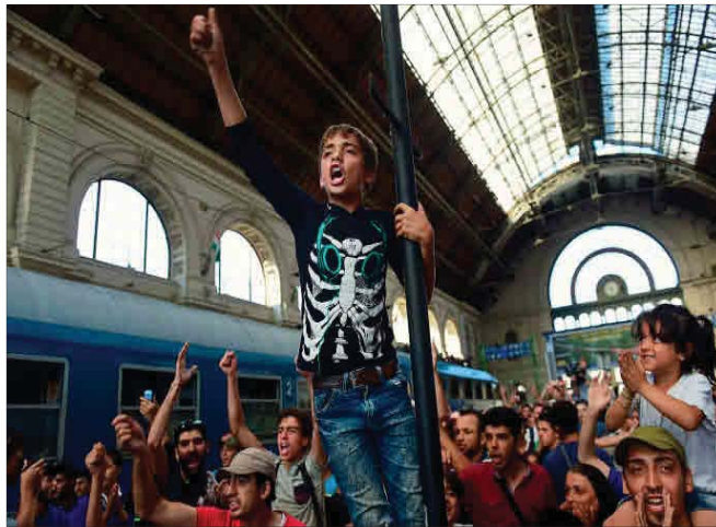
Una niña aplaude la protesta de su compañero, entre los cientos de inmigrantes retenidos ayer en la estación del Este de Budapest.

MARISOL HERNÁNDEZ MADRID En el epílogo de la legislación, el PP intenta ganar terreno en Cataluña con una reforma del Constitucional que permitiría suspender en sus funciones a Artur Mas en caso de desobediencia. A menos de cuatro semanas del 27-S, el Partido Popular quiere modificar la ley para que las sentencias del Constitucional sean de obligado cumplimiento. El candidato popular, Xavier García Albiol, había pedido a la dirección del partido apoyo político en Cataluña. SIGUE EN PÁG. 6 / EDITORIAL EN PÁG. 3