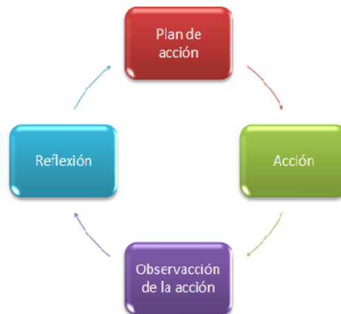
Figura 2. Ciclo de investigación –acción. Latorre (2003)

La reflexión rememora la acción tal como ha quedado registrado a través de la observación pero es un elemento activo. Pretende hallar el sentido de los procesos, los problemas y las restricciones. Tiene un aspecto valorativo.