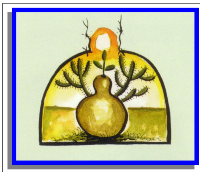
Escudo de la Comisión Pastoral de la Tierra del Nordeste Brasileño.

los/as campesinos/as para llenarlas de agua y llevarlas al campo a la hora de trabajo. Quiere incluir el trabajo y la lucha por agua, además de una presencia solidaria junto a los pueblos ribereños (los pueblos que dependen de ríos y mares para su subsistencia. El agua es otro de los bienes con cerca y usado para dominar y someter al pueblo. Luego vemos el cardo típico nordestino, de un clima semiárido. La identificación de una cultura, un pueblo que resiste bajo una dureza climática y que tiene una riquísima cultura. La C.P.T. además de ser parte de dicha cultura reafirmará junto a este pueblo el valor de ser campesino/a y nordestino (dos apelativos excluyentes en la cultura dominante de Brasil) La CPT trabajará la cuestión identitaria de espacio de geográfico, cultural, étnico para acompañar el proceso de empoderamiento de un pueblo que se le ha dejado al margen de la historia, sólo para aparecer como explotados y expoliados. La C.P.T. entiende que escribir la historia pasa por recogerla, reescribirla y contar los procesos de conquista. Es por esto mismo que tendrá la labor de sistematizar las experiencias de los pueblos de la tierra y del agua.