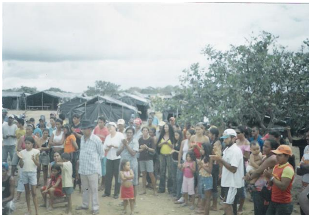
Foto: Acampados/as de la Hacienda San Luis en Asamblea.