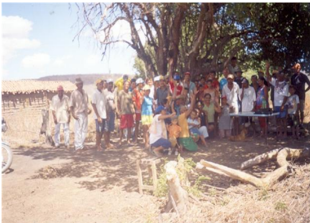
Foto: 1ª Reunión de los/as trabajadores/as sin tierra de la Hacienda San Luis. Se celebró debajo de este árbol.