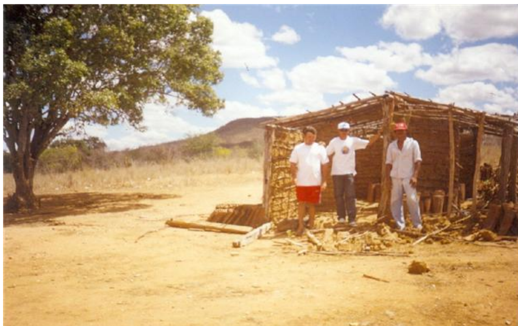
Foto: Las casas derrumbadas por orden del terrateniente.

El dueño manda derrumbar las plantaciones y las casas. Se vuelve a poner una gran cerca. Se les prohíbe el paso a la hacienda. Familias enteras quedan al descubierto. Sin techo, sin cosecha...y peligro por las amenazas de pistoleros.