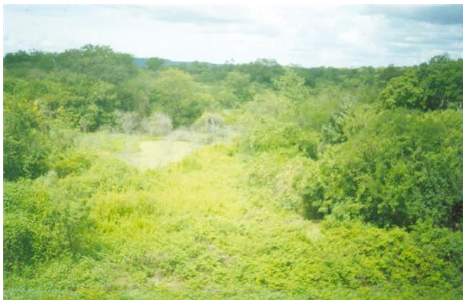
Hacienda San Luis en el Municipio de Pio IX (Estado de Piauí)