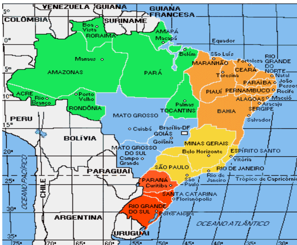
Mapa político de Brasil, dividido por Estados. El color marrón abarca el nordeste brasileño donde se ubica la experiencia.

¿Qué es la Comisión Pastoral de la Tierra?