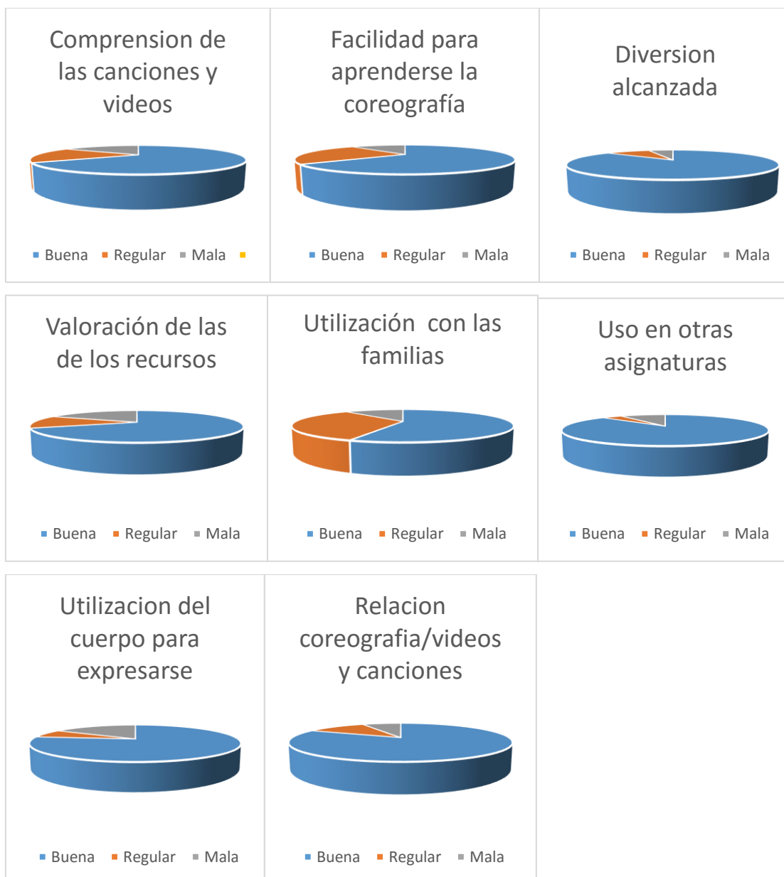
Fig. 2: Gráficos del resultado de la encuesta

Esta encuesta y sus resultados posteriores mostrados en los gráficos son un elemento de análisis para el desarrollo de mi trabajo, la investigación sobre las TIC en las aulas.