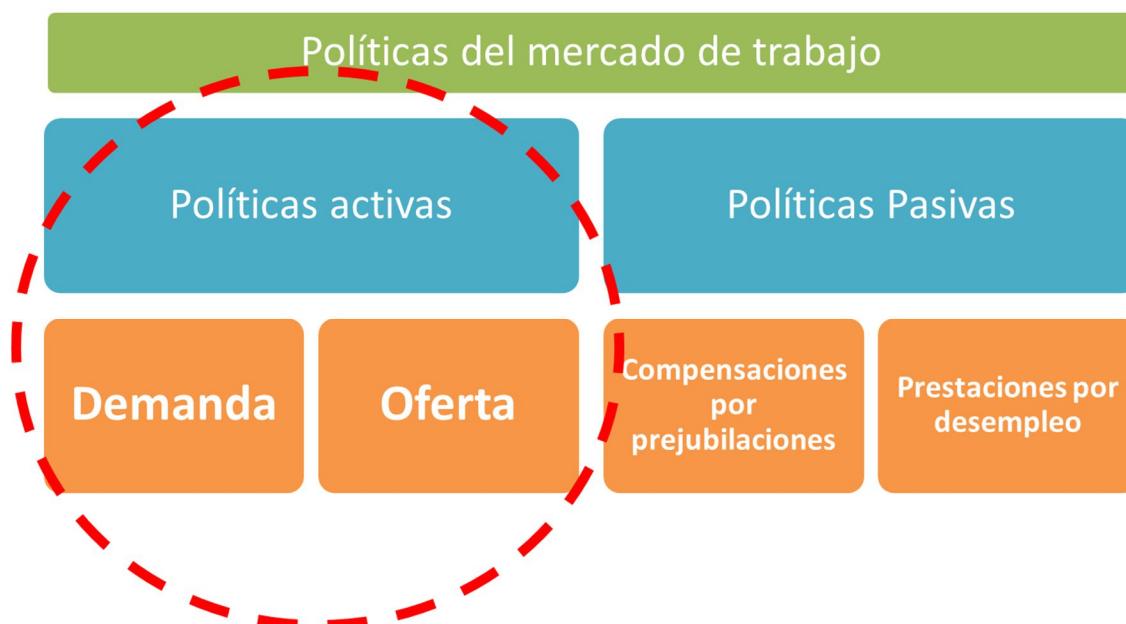
Grafico1: Clasificación de las políticas activas de empleo.

Estos dos tipos de políticas del mercado de trabajo con el programa nacional de reformas tienden a convertir las políticas pasivas en políticas activas para la protección por desempleo con la finalidad de conseguir un marco laboral más eficiente y dinámico, tratando de reforzar o mejorar los mecanismos preventivos y la empleabilidad en personas con dificultades laborales. Entre las diferentes políticas activas de protección por desempleo podemos considerar como más habituales en los planes anuales de políticas de empleo las siguientes: formación, igualdad en las oportunidades laborales, autoempleo y creación de empresas, orientación y formación profesional, todas ellas encaminadas a la búsqueda de la activación e inserción de los trabajadores.