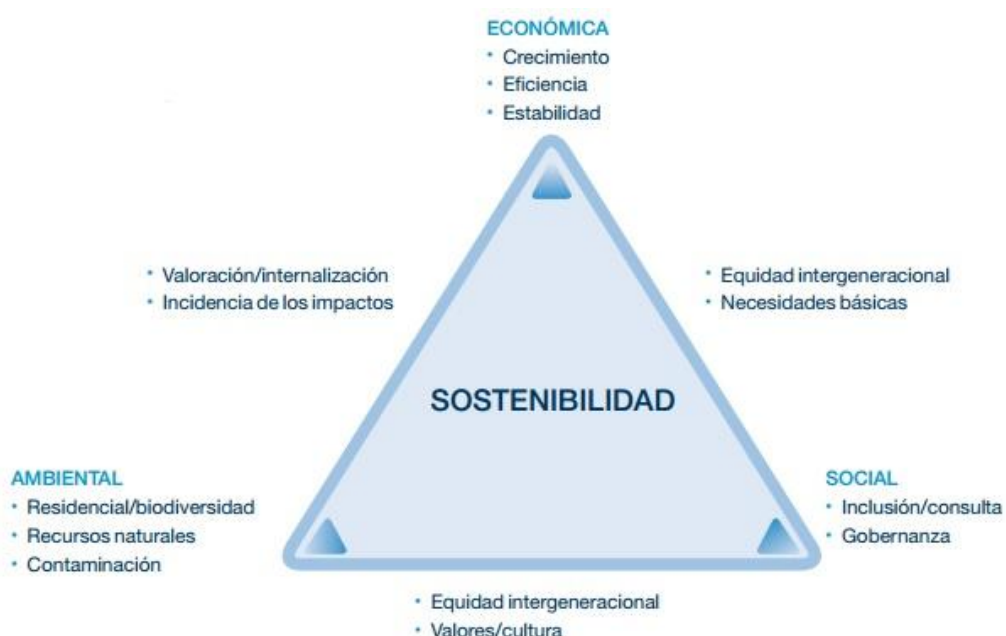
Figura Nº1. Las dimensiones de la sostenibilidad y sus interrelaciones