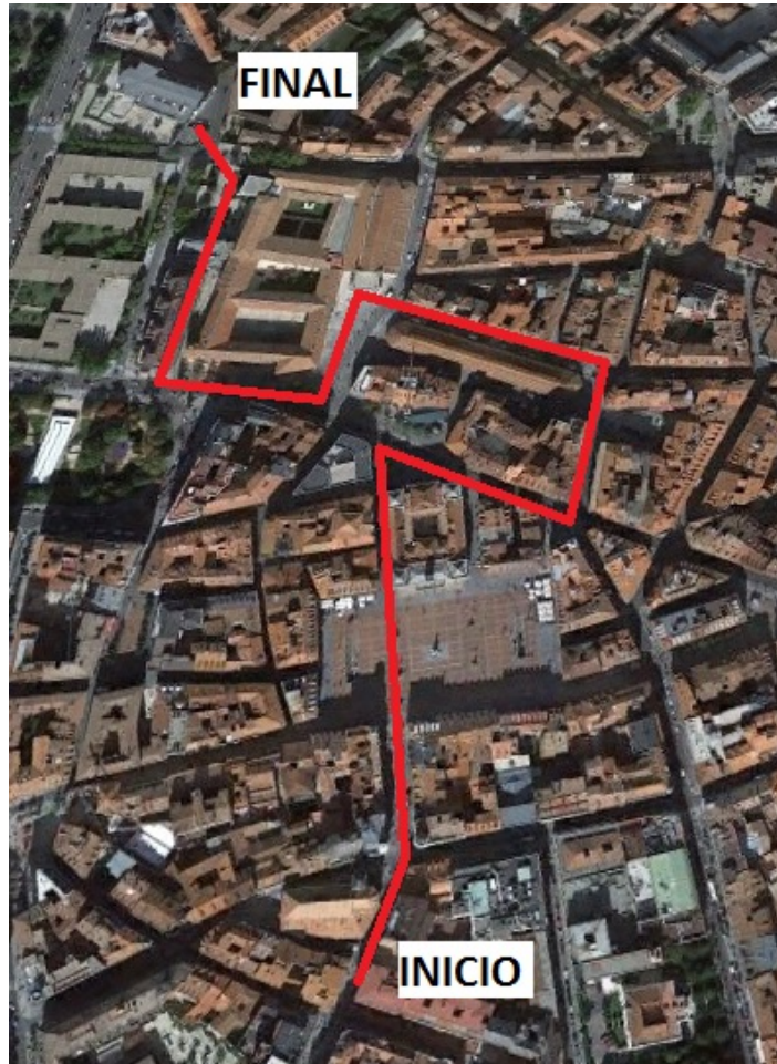
Figura 1. Itinerarios urbano 1.

que se da a su interior como espacio de culto; la Plaza del Val, un mercado tradicional de abastos con carnicerías, fruterías, etc.; el Museo de Arte Contemporáneo, donde podrán conocer obras de arte más vanguardistas; y el archivo de San Agustín, como un espacio destinado al almacenaje de documentación de carácter histórico.