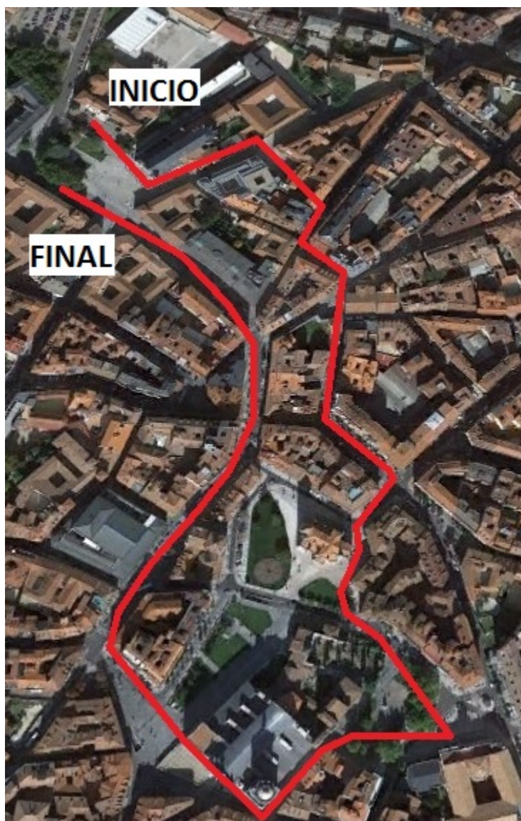
Figura 2. Itinerarios urbano 2.

El itinerario del Campo Grande (Figura 3) es imprescindible si se quiere conocer la ciudad de Valladolid. Es el parque histórico por excelencia, y se localiza en el centro de la misma. Este recorrido permitirá conocer elementos representativos que se encuentran en sus inmediaciones como es la estación de tren; algunos de los personajes más representativos de la historia de Valladolid a través de las estatuas ubicadas por el parque; elementos del medio físico como pueden ser la flora y la fauna más características de este espacio, pues el parque cuenta con animales, tales como pavos reales, ardillas, palomas o patos, así como la vegetación propia del lugar; o la entrada principal, con la puerta del príncipe, antigua entrada a la ciudad por el sur.