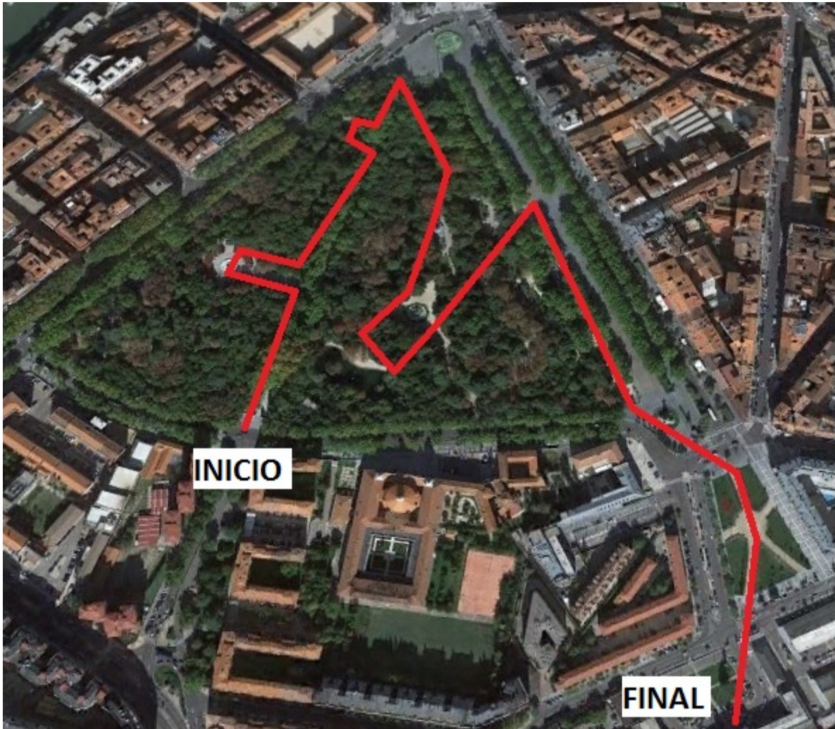
Figura 3. Itinerarios del Campo Grande.

Finalmente, el cuarto itinerario es el de la ribera del río Pisuerga (Figura 4). Al igual que en el Campo Grande, se estudiarán elementos del paisaje natural, como es el propio río y la fauna y flora asociadas al mismo, pero con especial atención a los efectos de la intervención humana sobre este tipo de paisaje natural, y prestando importancia a las actitudes de colaboración y conservación del medio ambiente. También se tendrán en cuenta elementos del medio urbano, como es el Puente Mayor, el primer puente que tuvo la ciudad, y la entrada desde el norte, la antigua harinera ubicada en un pequeño ramal urbano del Canal de Castilla, medios de transporte, como es el barco con la Leyenda del Pisuerga (un barco que hace un recorrido fluvial por el Pisuerga), o las pistas deportivas y los parques en los que se podrá trabajar actividades de exploración al aire libre.