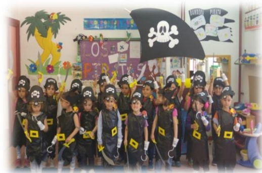
Ilustración 6: Los niños disfrazados de piratas

Utilizando bolsas de basura, goma eva, grapadora, pegamento y tijeras, los niños con mi ayuda realizarán su propio disfraz pirata, el cual utilizarán para la representación del teatro.