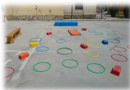
Ilustración 2: Juego del naufragio

Durante la actividad se irán realizando fotos con el fin de obtener una imagen divertida de la actividad, las cuales posteriormente serán colgadas en el rincón de la clase destinado al humor pirata.