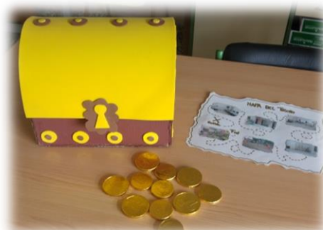
Ilustración 4. Tesoro y mapa del tesoro

Para desplazarse de un sitio del colegio a otro, los niños deberán realizarlo como se les indique en el mapa del tesoro, por ejemplo, para ir de clase a la sala de ordenadores deberán dar pasos de pulga o para ir de la sala de ordenadores al patio deberán aplaudir.