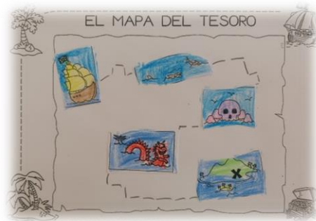
Ilustración 5: Elaboración de un mapa del tesoro

Deberán recortar los que hayan seleccionado para pegarlos en su mapa del tesoro, y a continuación, con lapicero deberán unir cada imagen según el orden que hayan establecido. Finalmente, los mapas del tesoro elaborados por cada alumno serán expuestos explicando que imágenes aparecen y porque lo han unido así, quedando explicaciones en ocasiones poco coherentes, divertidas y graciosas.