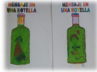
Ilustración 3: Mensaje en una botella

Cada niño tendrá una botella dibujada en un folio, en ella deberán mandar un mensaje divertido a uno de sus compañeros, previamente seleccionado para que todos tengan su mensaje y nadie se repita o alguno se quede sin él.