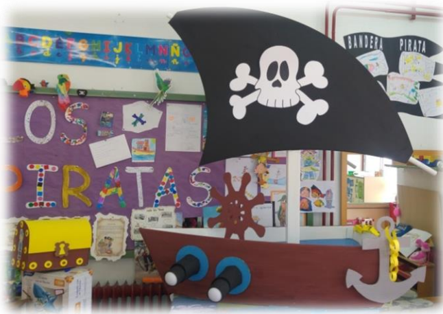
Ilustración 1: Ambientación de un aula pirata

Los niños recibirán un pergamino del pirata “Malapata”, en el cual les explica que como todo pirata, ellos también deben tener su propio barco pirata. Por eso les ha dejado un barco a tamaño real, el cual tienen que decorar y reformar para que sea un verdadero barco pirata.