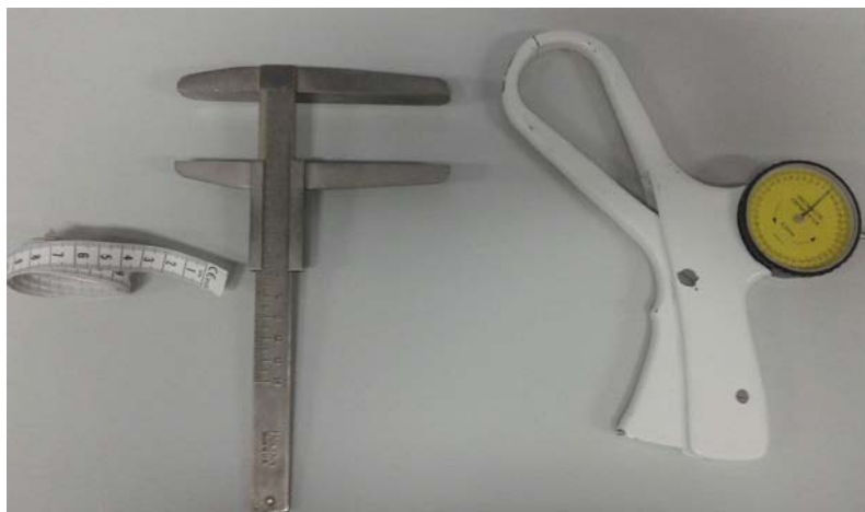
Imagen 1. Material antropométrico

Para la valoración antropométrica utilizamos como material una báscula de la marca Seca, con una precisión de \pm 100 gr.; un tallímetro de la misma marca, con una precisión de \pm 1 mm.; un plicómetro Holtain, con una precisión de \pm 0,2 mm.; un paquímetro Holtain, con precisión de \pm 1 mm.; y una cinta métrica, de la marca Seca, con una precisión de \pm 1 mm.