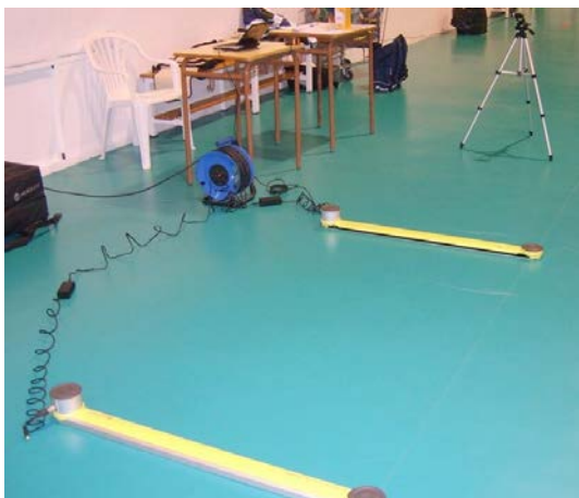
Imagen 2. Opto Jump