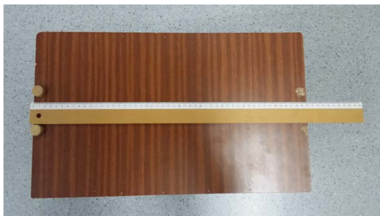
Imagen 4- Sit and reach

En lo relativo a la flexibilidad, se evaluó la flexibilidad posterior del tronco mediante la prueba "sit and reach", utilizando para ello un cajón de madera de una altura de 34 cm. con una regla fijada en la parte superior, siendo el valor 0 cm. la tangente de los pies, con una precisión de 0,1cm.