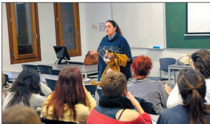
Titiriuva es un proyecto de innovación que muestra el potencial educativo de los títeres. JAMARERO

La compañía de teatro La Chana será la encargada de levantar el telón en la tarde del lunes, día 6 en el aula 124 del campus María Zambrano. Los organizadores han definido la sesión como una ponencia-taller-espectáculo.