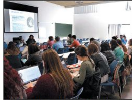
Debate en las aulas de Publicidad y Relaciones Públicas.