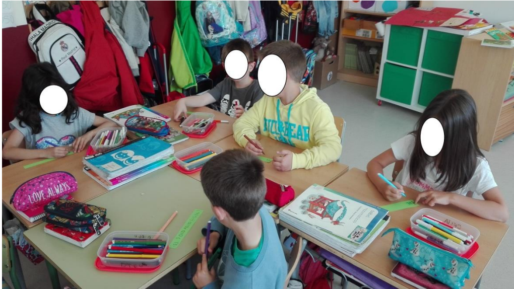
Imagen 4. Alumnos creando su eslogan 2.

Del mismo modo que en los anteriores libros, les resultó muy complicado decirnos que les había transmitido tanto el libro como las actividades que hemos realizado en relación con el mismo, es más, no supieron resolverse esto.