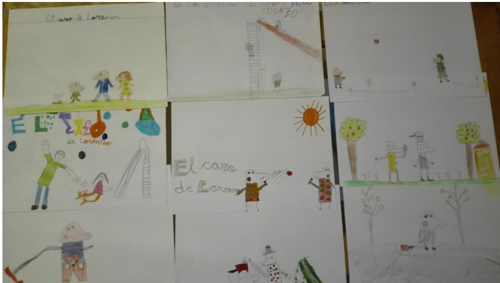
Imagen 8. Dibujos hechos por los alumnos 1.

Los siguientes dibujos, pertenecientes a casi todos los alumnos que componen el aula, ya que algunos no les realizaron, se mandaron con la idea de que los estudiantes reflejaran en los mismos lo que el libro les había transmitido. Podemos comprobar como más que esbozar lo que les transmitía el libro, han realizado una de las secuencias que vieron en el mismo, posiblemente la que más les gustó.