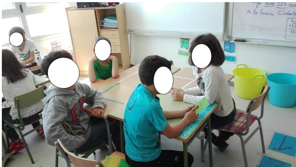
Imagen 2. Alumnos trabajando con Las tarjetas preguntonas .

Mientras narrábamos la obra los alumnos se encontraban bastante atentos, lo que más adelante pudimos comprobar con Las tarjetas preguntonas , ver imagen 2. Cuando usamos dichas tarjetas repartidas al azar entre los 5 grupos (de 5 alumnos cada uno) que componen el aula, nos asombró cómo tanto en la tarjeta de “Mi parte favorita ha sido...”, como en la de “Me ha gustado cuando...”, la mayoría de los alumnos resaltaron el momento en que aparece una mujer a ayudar a Lorenzo con su cazo.