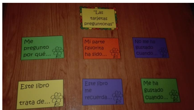
Imagen 1. Las tarjetas preguntonas

Para empezar a trabajar con el libro, lo primero que debemos comprobar es si los alumnos han comprendido la lectura y lo que este les quiere transmitir, para ello vamos a utilizar un recurso denominado Las tarjetas preguntonas , extraído del blog El rincón de una maestra .