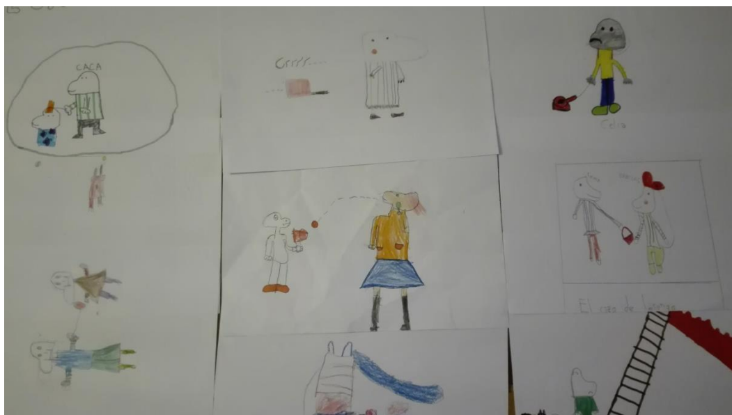
Imagen 9. Dibujos hechos por los alumnos 2