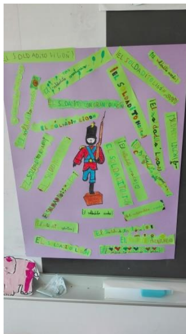
Imagen 5. Resultado final del mural del soldadito.

Por último, cabe citar que la cartulina DIN-A3 con el dibujo del soldadito en grande la trajimos hecha de casa para que los alumnos no se pelearan por ver quién fuera el que pintaba y pegaba el soldadito en la cartulina. El resultado final fue bastante hermoso, ver imagen 5.