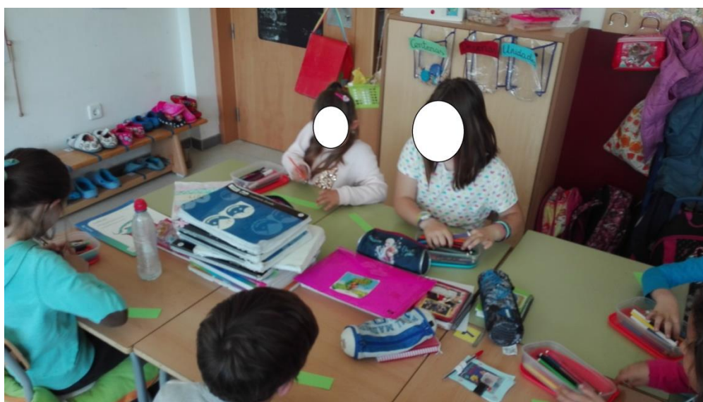
Imagen 3. Alumnos creando su eslogan 1.

Finalmente entendieron de qué trataba la actividad, y aunque algunas de las ideas se parecían bastante entre sí, fueron capaces de crear distintos slogans donde resaltaban, en su mayoría, las características que el libro exaltaba sobre el soldadito. Esta tarea, aunque en primera instancia debía de resolverse individualmente, pero al observar las complicaciones que existían, decidimos pensar en los slogans de manera conjunta, ver anexo 2 , y después, ya sí de manera autónoma, elegir uno y escribirle en un trozo de papel, ver imágenes 3 y 4 .