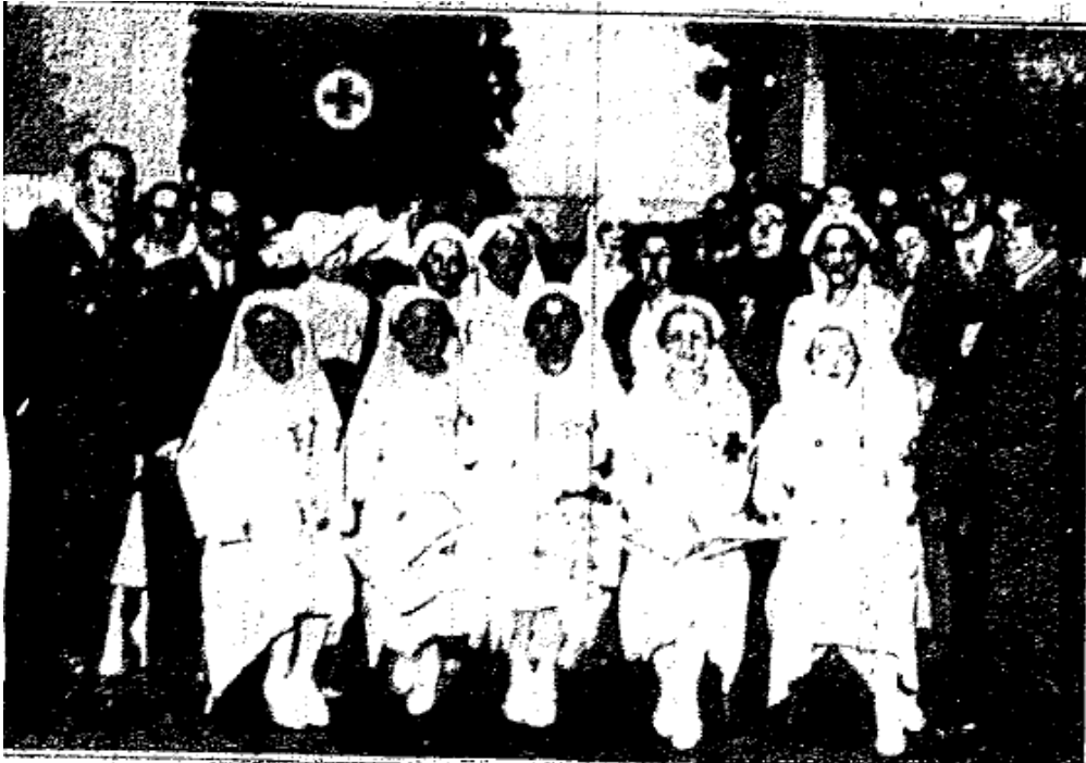
Imagen 1 – Enfermeras y médicos a los que les ha sido impuesta la Cruz del Mérito Militar, por los servicios prestados en Asturias, durante la revolución del mes de Octubre.