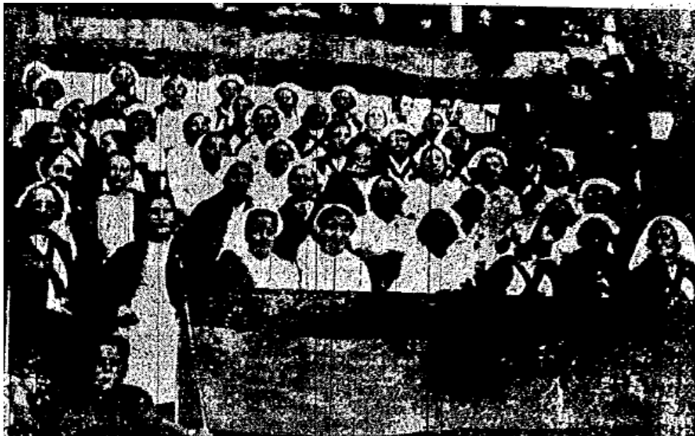
Imagen 2 – Las damas enfermeras presenciando la corrida.