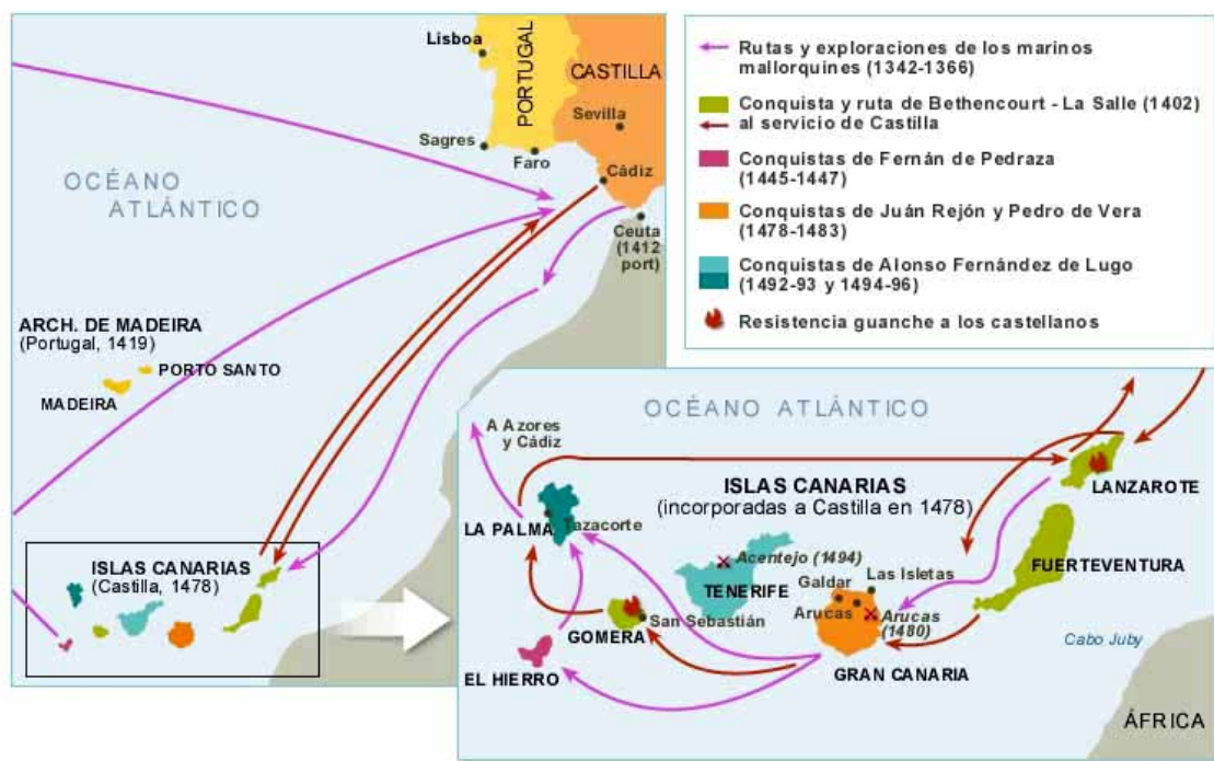
FIGURA 2: ASPECTO DEL OCÉANO EN EL TRATADO DE ALCÁZOVAS