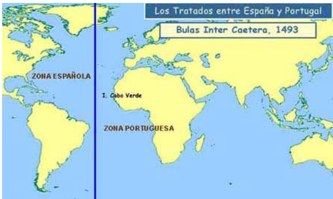
FIGURA 3: LA DIVISIÓN DEL OCÉANO EN LA BULA INTER CAETERA

http://apuntes.santanderlasalle.es/historia_2/webs_historia/reyes_catolicos/reyes_catolicos.htm