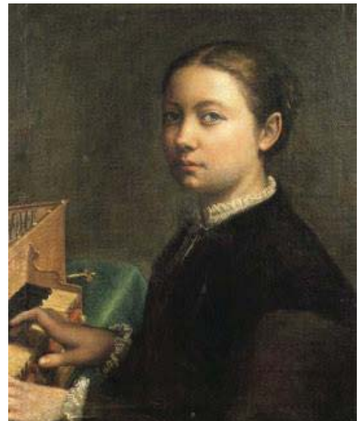
Fig. 4, SOFONISBA ANGUISSOLA Autorretrato con espineta , 1555 Althorp, Colección Spencer