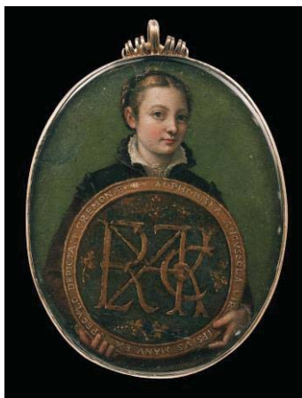
Fig. 18, SOFONISBA ANGUISSOLA Autorretrato en miniatura, ca. 1555 Boston, Museo de Bellas Artes