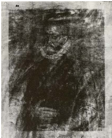
Fig. 37, SOFONISBA ANGUISSOLA Radiografía retrato de Felipe II , 1564