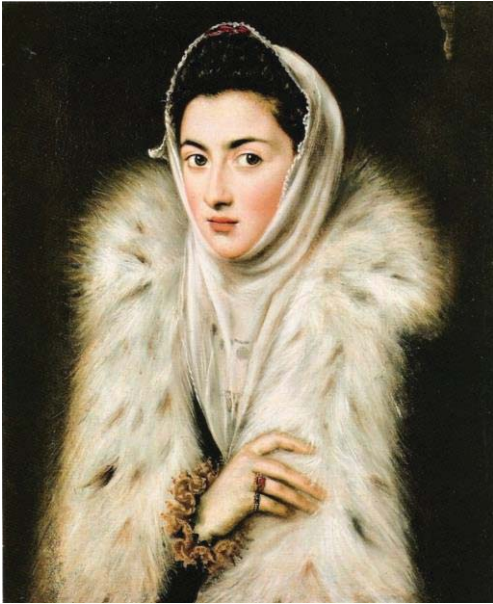
Fig. 50, SOFONISBA ANGUISSOLA? EL GRECO? Retrato de la Infanta Catalina con cuello de Lince / La Dama del Armño, 1591 Glasgow, Pollok House