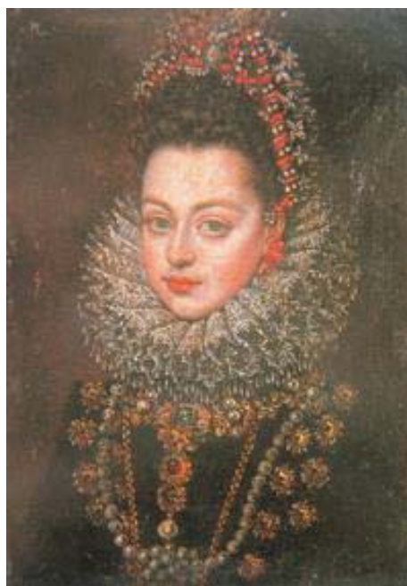
Fig. 56, SOFONISBA ANGUISSOLA Miniatura de Isabel Clara Eugenia , 1599 Madrid, Subastas Alcalá