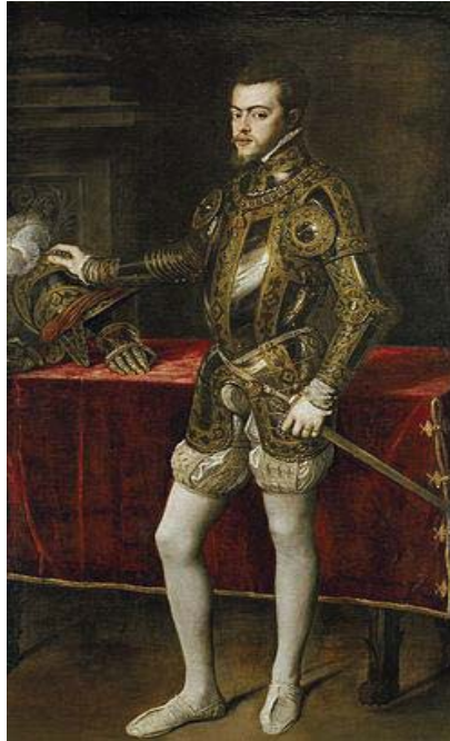
Fig. 28, TIZIANO Retrato de Felipe II , 1550-1551 Madrid, Museo del Prado