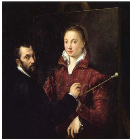
Fig. 21, SOFONISBA ANGISSOLA Bernardino Campi pintando a Sofonisba Anguissola , 1558 Siena, Pinacoteca Nacional