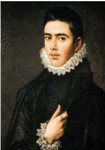
Fig. 43, SOFONISBA ANGUISSOLA Retrato de joven con capa , ca. 1590 Estados Unidos, Colección Particular