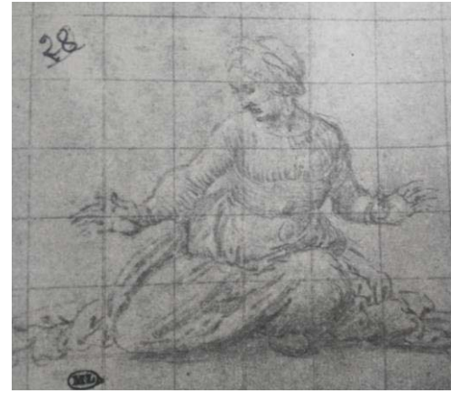
Fig. 7, SOFONISBA ANGUISSOLA Figura femenina de cuclillas París, Museo del Louvre