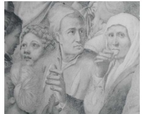
Fig. 10, BERNARDINO GATTI Detalle Multiplicación de los panes y los peces. Cremona, refectorio de San Pedro del Po