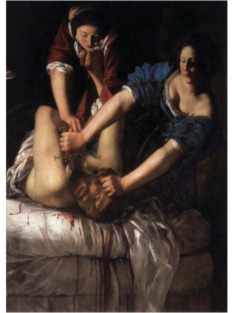
Fig. 2, ARTEMISA GENTILESCHI Judith y Holofernes , 1613 Florenca, Galería Uffizi