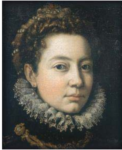
Fig. 41, SOFONISBA ANGUISSOLA Autorretrato con rizos y copete , 1580-1590 Chantilly, Musée Condé