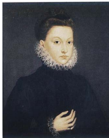
Fig. 38, SOFONISBA ANGUISSOLA Retrato de la Infanta Isabel Clara Eugenia , ca. 1573 Turín, Galería Sabauda