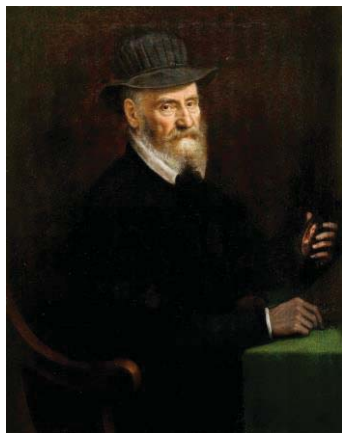
Fig. 17, SOFONISBA ANGUISSOLA Retrato de Giulio clovio, 1556 Mentana, Colección Federico Zeri