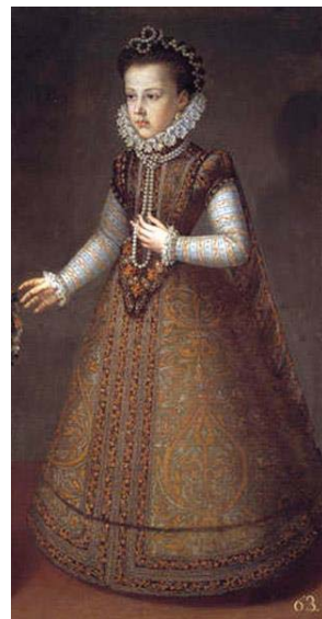
Fig. 49, SÁNCHEZ COELLO, Retrato de la Infanta catalina niña , 1575 Madrid, Museo del Prado