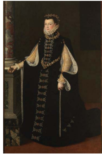
Fig. 36, SOFONISBA ANGUISSOLA Retrato de Isabel de Valois , 1565 Madrid, Museo del Prado