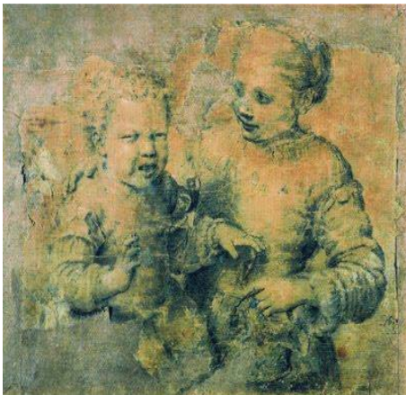
Fig. 13, SOFONISBA ANGISSOLA Niño mordido por un cangrejo Florenca, Galeria Uffizi