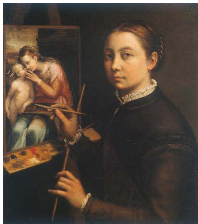
Fig. 16, SOFONISBA ANGUISSOLA Autorretrato pintando, 1555 Lancut, Museo Zanek