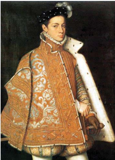
Fig. 33, SOFONISBA ANGUISSOLA Retrato de Alejandro Farnesio , 1561 Irlanda, Museo Nacional de Dublín