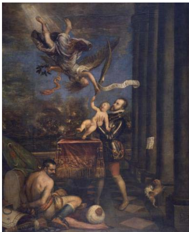
Fig. 29, MICHELE PARRASIO Alegoría del nacimiento del Infante Don Fernando , 1575 Madrid, Museo del Prado