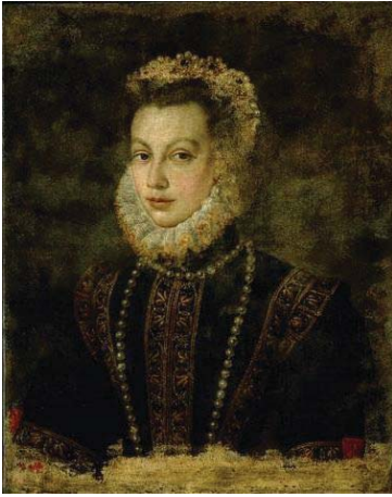
Fig. 40, SOFONISBA ANGUISSOLA Busto de Isabel de Valois , 1581 Viena, Kunsthistorisches Museum