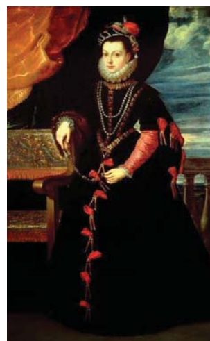
Fig. 23, RUBENS según SOFONISBA ANGISSOLA retrato de Isabel de Valois , 1561 Toledo, Colección particular