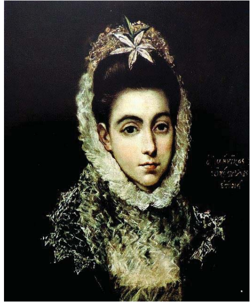
Fig. 51, EL GRECO La Dama de la Flor, 1590 Londres, Warwick House, Colección Vizconde de Rothermere