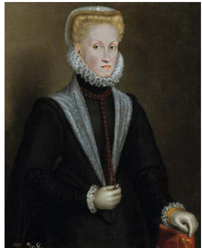
Fig. 27, SOFONISBA ANGUISSOLA Retrato de Ana de Austria , 1575 Madrid, Museo del Prado