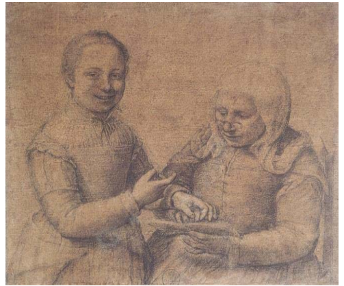
Fig. 12, SOFONISBA ANGISSOLA Niña enseñando a leer a una vieja Florenca, Galeria Uffizi