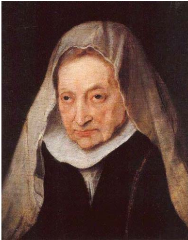
Fig. 46, VAN DYCK Retrato de Sofonisba , 1624 Kent, Sackville Collection