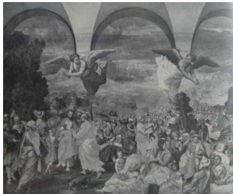
Fig. 9, BERNARDINO GATTI Multiplicación de los panes y los peces. Cremona, refectorio de San Pedro del Po