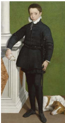
Fig. 20, SOFONISBA ANGISSOLA El marqués de Socino niño , ca 1557 Walters Arts Gallery, Baltimore