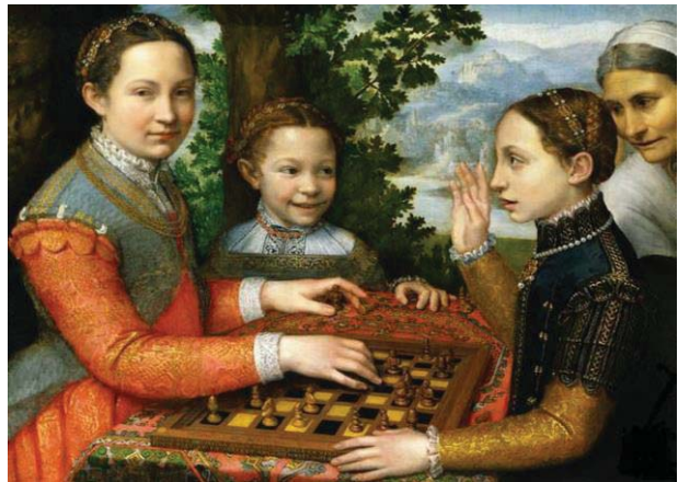
Fig. 14, SOFONISBA ANGISSOLA Juego del ajedrez, 1555 Polonia, Museo Narodowe