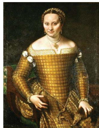
Fig. 19, SOFONISBA ANGUISSOLA retrato de dama o de su madre, 1557 Berlín, Staatliche Museum