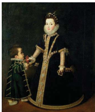
Fig. 52, SOFONISBA ANGUISSOLA? SÁNCHEZ COELLO? Retrato de Margarita de Saboya con el enano , 1593 Madrid, Colección Marqués de Griñón