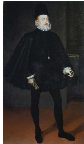
Fig. 47, SÁNCHEZ COELLO Retrato de Felipe II con capa y gorra , 1568 Florenca, Palacio Pitti