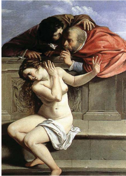
Fig. 1, ARTEMISA GENTILESCHI Susana y los viejos , 1610 Alemania, Palacio de Weissenstein