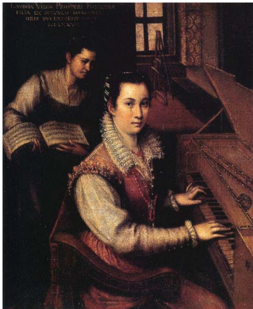
Fig. 3, LAVINIA FONTANA Autorretrato tocando el clavicordio , 1557 Roma, Academia de San Luca