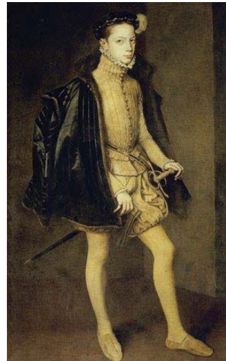
Fig. 34 ANTONIO MORO Retrato de Alejandro Farnesio , 1557 Galería Nacional de Parma