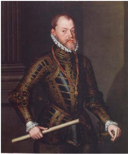
Fig. 24 ALONSO SÁNCHEZ COELLO Retrato de Felipe II , ca. 1570 Glasgow, Pollok house