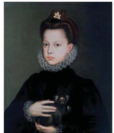
Fig. 39, SOFONISBA ANGUISSOLA Retrato de la Infanta Catalina Micaela , ca. 1573 Londres, Colección Rafael Valls