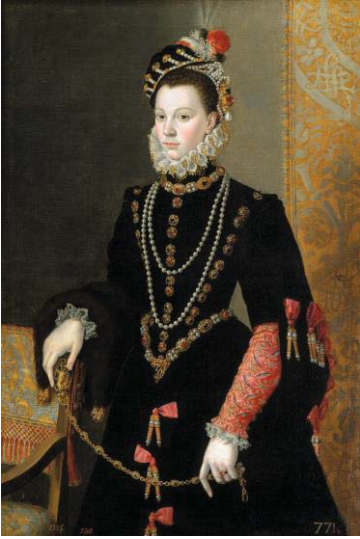
Fig. 31, PANTOJA DE LA CRUZ según SOFONISBA ANGUISSOLA Retrato de medio cuerpo de Isabel de Valois , 1561 Madrid, Museo del Prado