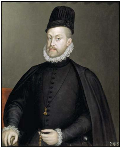
Fig. 26, SOFONISBA ANGUISSOLA Retrato de Felipe II , 1575 Madrid, Museo del Prado