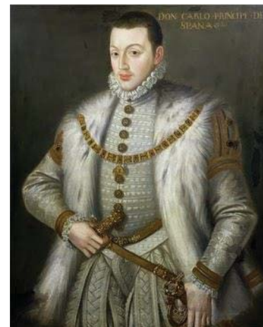
Fig. 30, ALONSO SÁNCHEZ COELLO según SOFONISBA ANGUISSOLA Retrato de Don Carlos , 1566-1567 Madrid, Colección particular