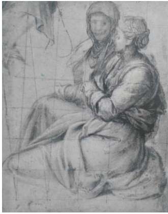
Fig. 11, BERNARDINO GATTI Estudio de un dibujo Florenca, Galeria Uffizi