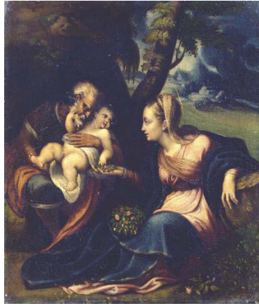
Fig. 6, SOFONISBA ANGUISSOLA Sagrada Familia, 1559 Bérgamo, Academia Carrara.