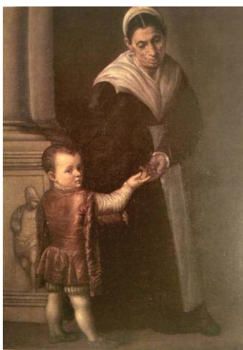
Fig. 22, SOFONISBA ANGISSOLA Retrato de un niño con ama , 1559 Hermitage, San Petersburgo