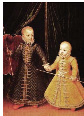
Fig. 54, SÁNCHEZ COELLO Infantes Diego y Felipe , 1579 Madrid, Descalzas Reales