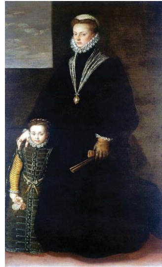
Fig. 32, SOFONISBA ANGUISSOLA Retrato de Juana de Austria , 1561 Boston, Museo Isabella Stewart Gardner