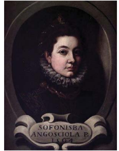
Fig. 42, BERNARDO CASTELLO Copia Autorretrato de Sofonisba Anguissola , 1620 Roma, Academia de San Luca