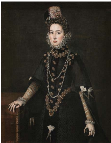
Fig. 48, SOFONISBA ANGUISSOLA Retrato de la Infanta Catalina Micaela como Duquesa de Saboya , 1585 Madrid, Museo del Prado