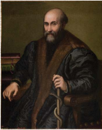
Fig. 5, LUCIA ANGUISSOLA Pedro de María, médico de Cremona, 1557. Madrid, Museo del Prado.