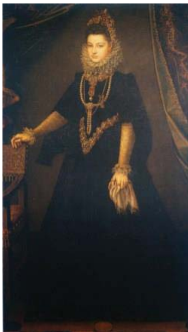
Fig. 55, SOFONISBA ANGUISSOLA Retrato de Isabel Clara Eugenia recién casada , 1599 París, Embajada Española