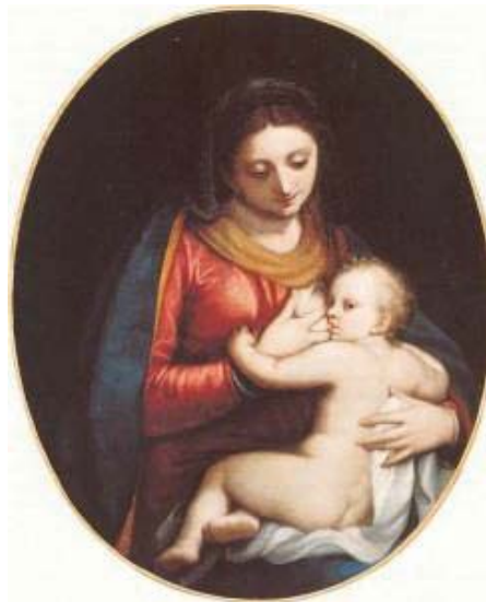
Fig. 44, SOFONISBA ANGUISSOLA Virgen con el Niño , 1588 Budapest Szepmüvészeti Muzeum