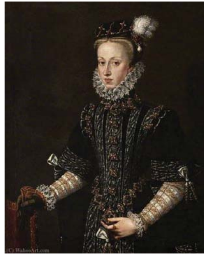
Fig. 25, ALONSO SÁNCHEZ COELLO Retrato de Ana de Austria , ca. 1570 Glasgow, Pollok House