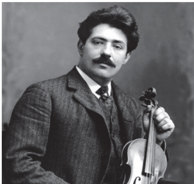
Imagen 1. Fritz Kreisler.