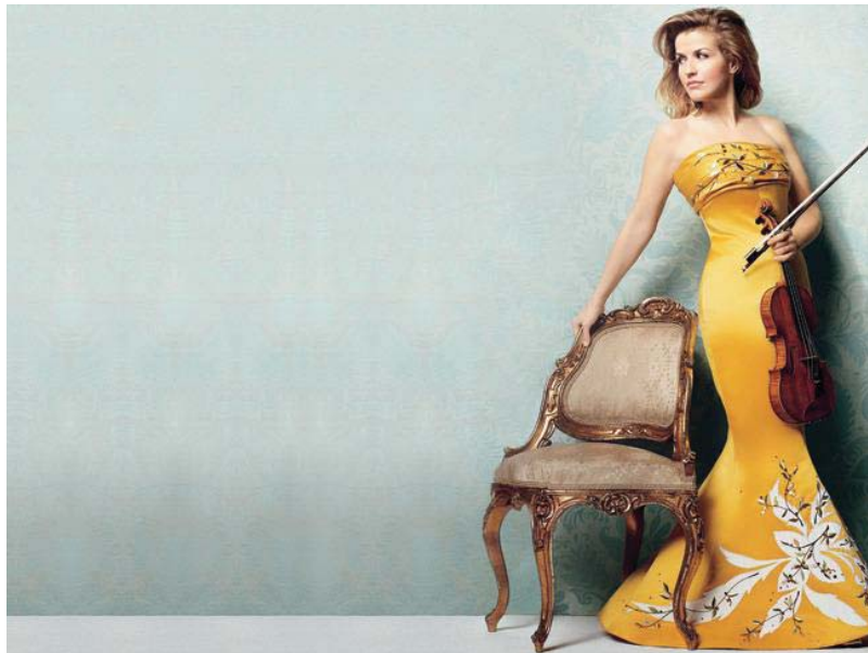
Imágen 8. Anne-Sophie Mutter.