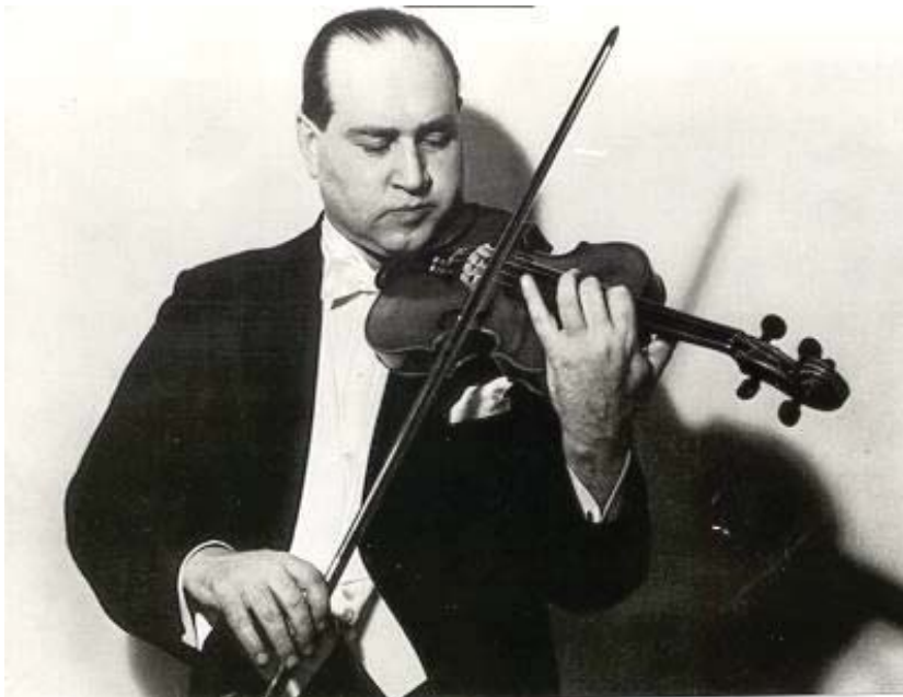
Imagen 3. David Oistrakh. Violin Student Central

Cuando las tropas alemanas invaden Rusia, Oistrakh se va al frente para tocar en las fábricas, en los hospitales y para animar a los soldados. El momento más dramático de su vida lo representa la interpretación que, del Concierto para violín y orquesta en Re mayor Op. 35 de Tchaikovsky, realiza en el invierno de 1942 en una sala en pleno centro de Stalingrado mientras la Luftwaffe bombardeaba la ciudad; es decir, en la zona cero de lo que luego los historiadores denominaron la Batalla de Stalingrado.