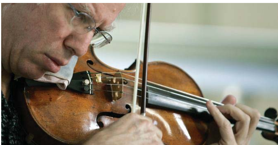
Imagen 6. Gidon Kremer. The listeners Club.

Enemigo de las convenciones, apasionado defensor de los compositores de su tiempo e infatigable explorador de nuevos repertorios, el violinista letón Gidon Kremer (Riga, 1947) lleva tres décadas paseando por el mundo su original, enigmático e innovador talento.