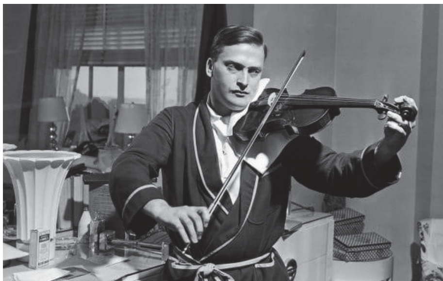
Imagen 4 Yehudi Menuhin.

Algunos de sus biógrafos atribuyen ese espíritu abierto y su entrega total a la música a un carácter por esencia bondadoso y humilde. Lo fue siempre. Poco antes de cumplir los 13 años de edad, tras un concierto en Berlín, el sabio Albert Einstein lo visitó en su camerino. Allí, entre abrazos, Einstein proclamó: "Ahora sé que existe Dios en el cielo".