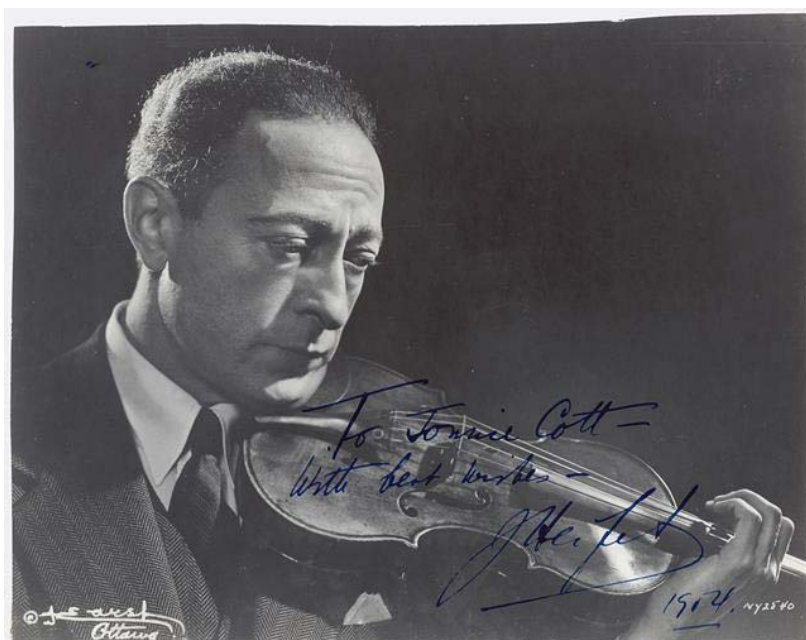
Imagen 2. J. Heifetz.