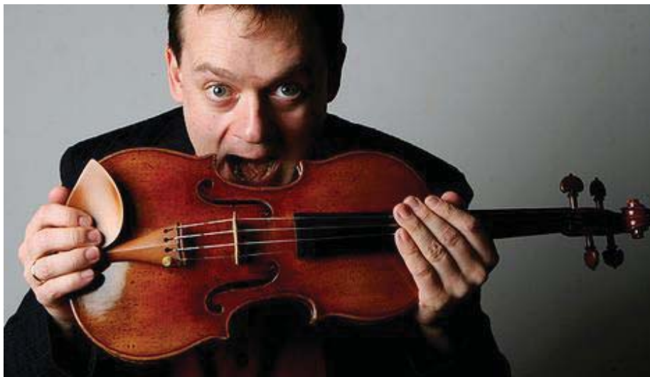
Imágen 9. F. Zimmermann.

Si lo tocó durante tantos años hay una parte de su alma, de su espíritu, en este instrumento. Hay que entenderlo y adaptarse a él. Me costó cinco años adaptarme a él. Compré otra vez las partituras y repensé toda la música otra vez (...) Voy a los lavabos con él si estoy en un restaurante. El precio, como un par de Ferraris de alta gama.