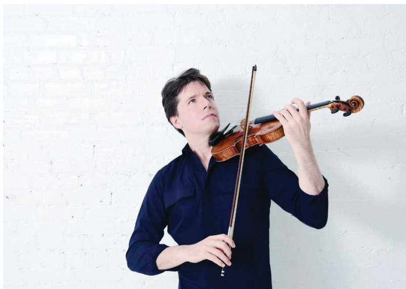
Imagen 10. Joshua Bell.

Alrededor de este gran intérprete, se ha desatado desde el pasado año 2007 una gran controversia, ya que ese año, llevó a cabo un experimento en el metro de Washington, que consistió en tocar allí durante una hora de incognito, para ver si alguien era capaz de apreciar la calidad de su música fuera de un contexto apropiado. Muy pocos fueron los que se quedaron a escucharle, consiguiendo reunir tan solo unos cuantos dólares y algo de calderilla.