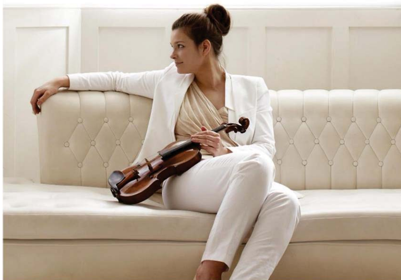
Imagen 15. Janine Jansen. Official Website.

- Me resulta difícil contestar a esta pregunta. Es verdad es que siempre he visto salas llenas, como el Auditorio de Madrid, donde estuve por última vez en octubre. Pero nunca me he planteado que pudiera ser por mí. Me imaginaba que era por el programa, por la calidad de la temporada, por la tradición o por la combinación de todos estos factores. Jamás habría pensado que yo era una de las razones. Sea por lo que sea, es bonito que la gente vaya a escuchar música.