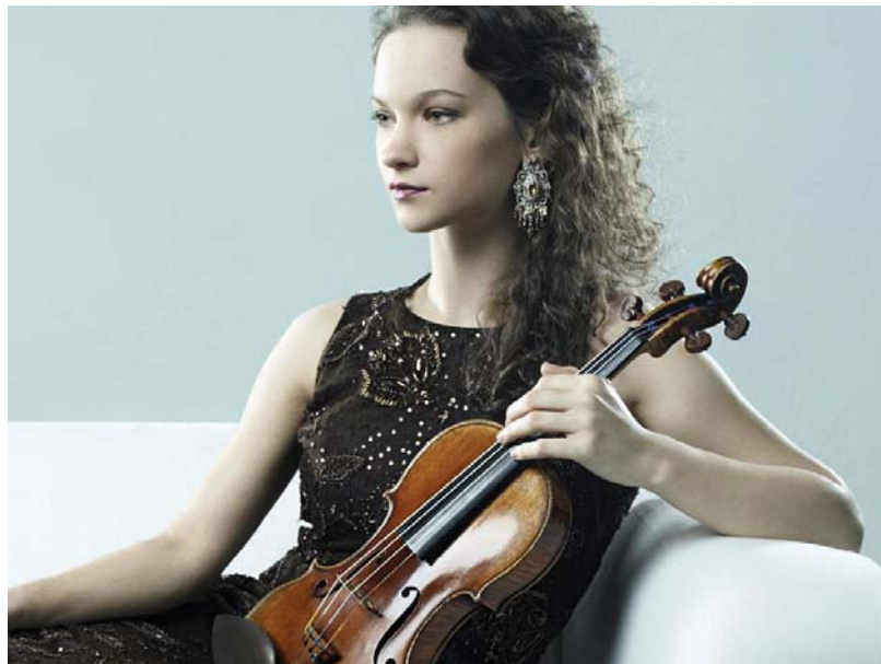
Imagen 16. Hilary Hahn.

El violín que toca, es una réplica del que perteneció a Niccolò Paganini conocido como “Il Cannone”, creado en París en el año 1864.