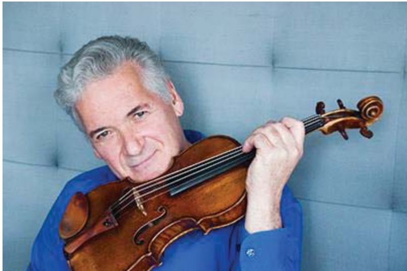
Imágen 7. Pinchas Zukerman. Orquesta Sinfónica de Euskadi

Además de ser un excepcional violinista, destaca como viola, como director de orquesta y como pedagogo. Quien le conoce le describe como una persona optimista y bromista, abierto siempre al cambio y a las nuevas tecnologías, pese a lo cual, y debido a las heridas históricas recientes que aún están abiertas declaró en una entrevista para el diario El País en el año 2013. que no tocaría música de Wagner en Israel hasta que dejase de provocar sufrimiento, alegando que no enseñar a Wagner sería un error, pero que mientras cause dolor en algunos sitios determinados, no lo interpretará por respeto.