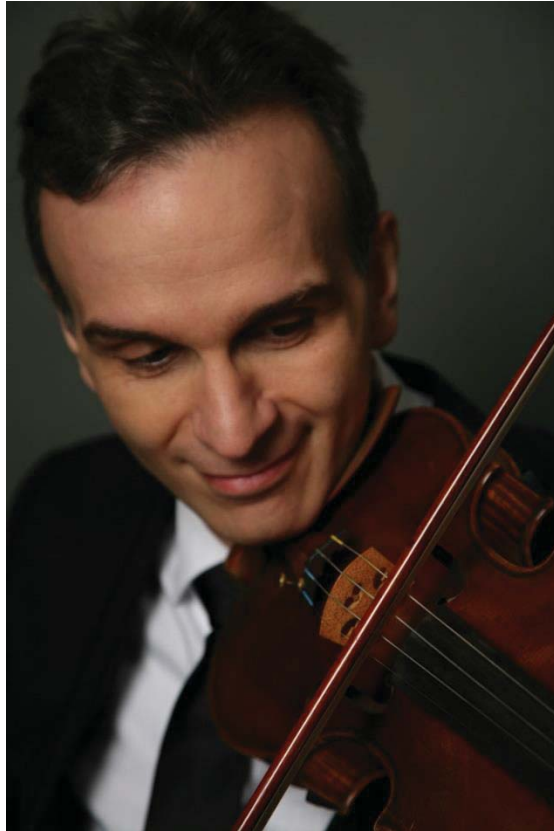
Imagen 13. Gil Shaham. Official Website.