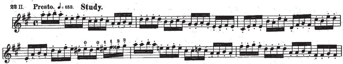
Ejemplo 4. Fragmento perteneciente al segundo volumen de estudios de Beriot.

Por último, cabe hablar del martelé . Este golpe de arco se caracteriza por necesitar de una preparación previa a la propia ejecución del movimiento. Es decir, se debe controlar que la presión del arco sobre la cuerda sea la necesaria para que al comenzar el desplazamiento del mismo se produzca un ataque pronunciado, para posteriormente levantar la presión y que la nota resuene. Tal y como explica Galamian (1962), debería producirse un pellizco en la cuerda antes de que comience el propio golpe de arco, y la dificultad de esto se encontraría en la coordinación levantando esta presión, ya que si se levanta pronto, el martelé no tiene lugar, y si por el contrario la presión es levantada tarde, produciríamos un ataque poco limpio, produciéndose algo a lo que denominamos como scratch , término que se traduce como rascar, y que en este caso aludiría precisamente la obtención de un sonido sucio y ahogado, sin resonancia.