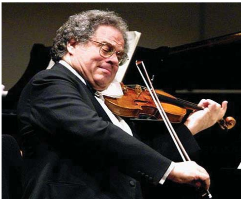
Imagen 5 I. Perlman.

Actualmente, ocupa el puesto de su profesora Dorothy DeLay en la academia Julliard, en la cual precisamente fue donde él se formó como violinista. Además de ser un reconocido violinista, ejerce como director de orquesta.