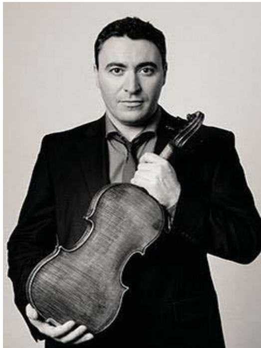
Imagen 14. Maxim Vengerov. Official Website.