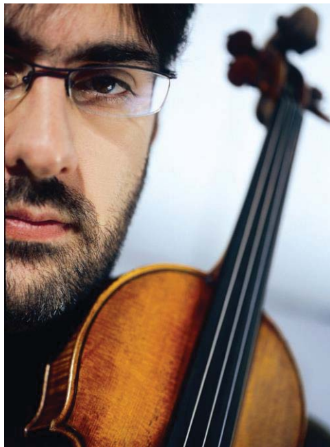
Imagen 11. Leonidas Kavakos.

Actualmente, toca el violín Stradivarius del año 1724 denominado “Abergavenny”, y cuenta que una vez al año dedica parte de su agenda a impartir master classes a jóvenes violinistas para poder transmitir sus conocimientos, algo que considera imprescindible para que la tradición violinística perviva.