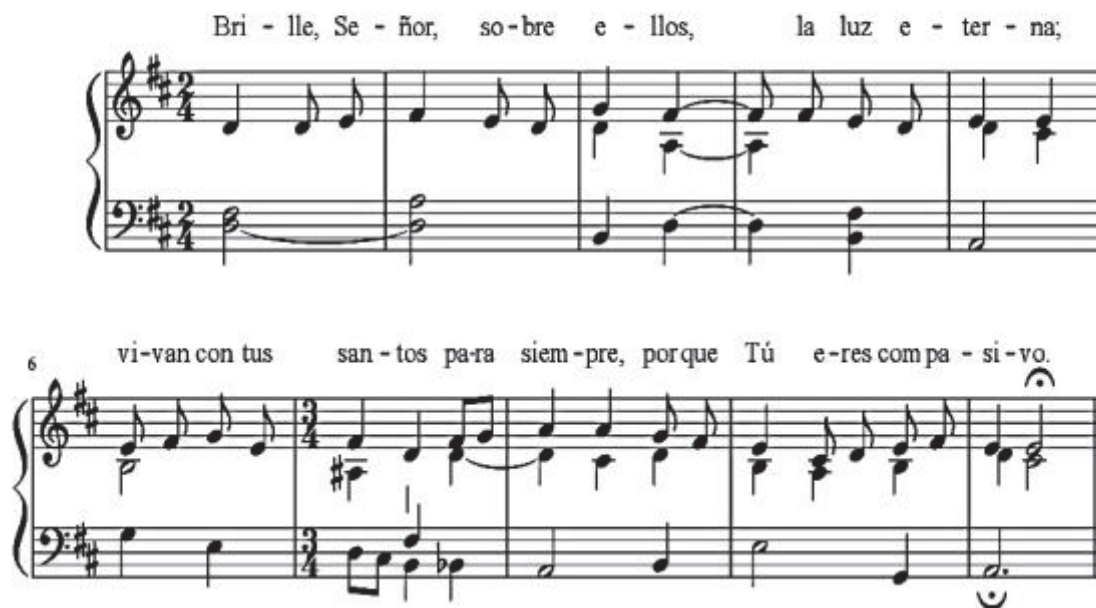
Ilustración 5: Brille, Señor, sobre ellos la luz eterna . Adaptación de Raúl del Toro.

IV Esdrás 2, 35; Salmo 129 Música: Raúl del Toro