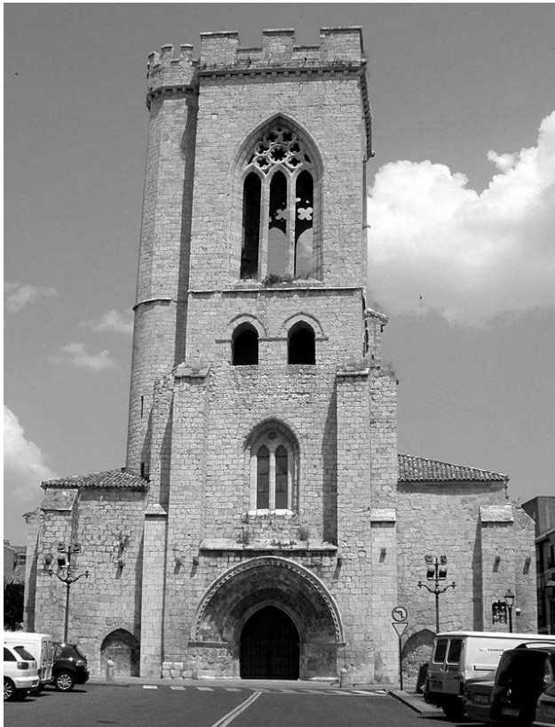
Foto 5. Iglesia de San Miguel 8

En la parte baja de la torre, se encuentra la puerta de acceso al templo formando un arco de medio punto, surcada con arquivoltas.