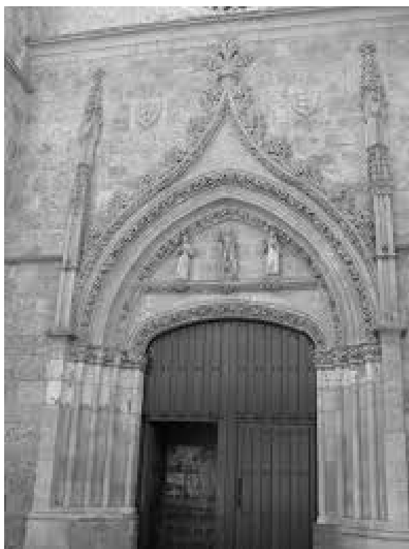
Foto 2. Iglesia de las Claras 4