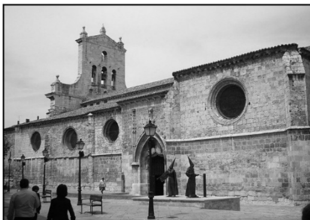
Foto 3. Iglesia de San Pablo 5