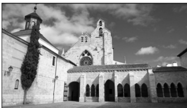
Foto 4. Iglesia de San Francisco 6