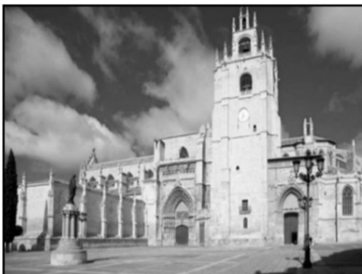
Foto 1. Catedral de Palencia 3