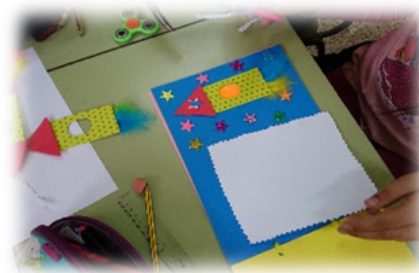
- Imágenes del proceso de elaboración de los cuentos