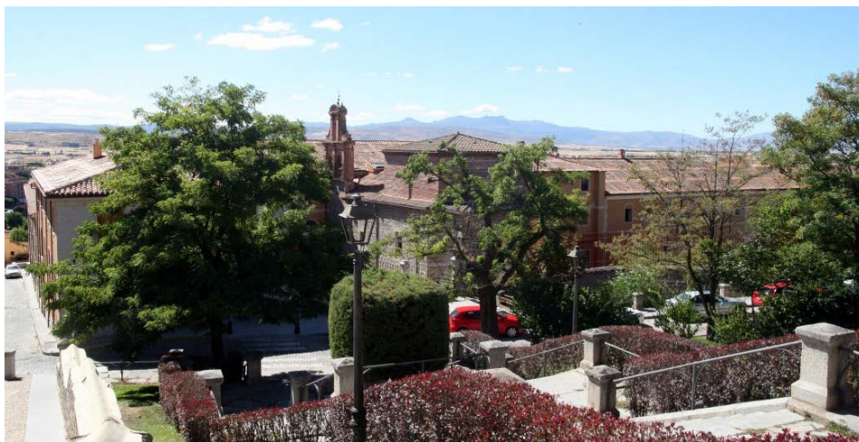
Fig. 1 Vista general del Hospital de La Misericordia de Ávila, con la iglesia en primer término.

Hospital de la Misericordia se instaló en el lugar que ya sería definitivo (fig. 1).