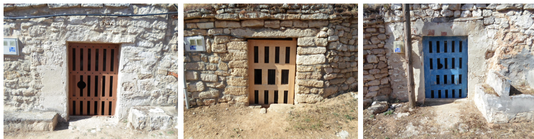
Fig. 2a /2b /2c. Torquemada. Frente exterior de bodega. Tres puertas de bodega con su característico enrejado para permitir la ventilación interior.

exterior de la bodega siguiendo sus trazas, y se compactaba formando un lomo ligeramente pronunciado, denominado también teso o culata. Este lomo de tierra da solidez a la construcción subterránea al agregarle peso a la bóveda, al tiempo que impide las filtraciones de agua de lluvia al interior de las galerías.