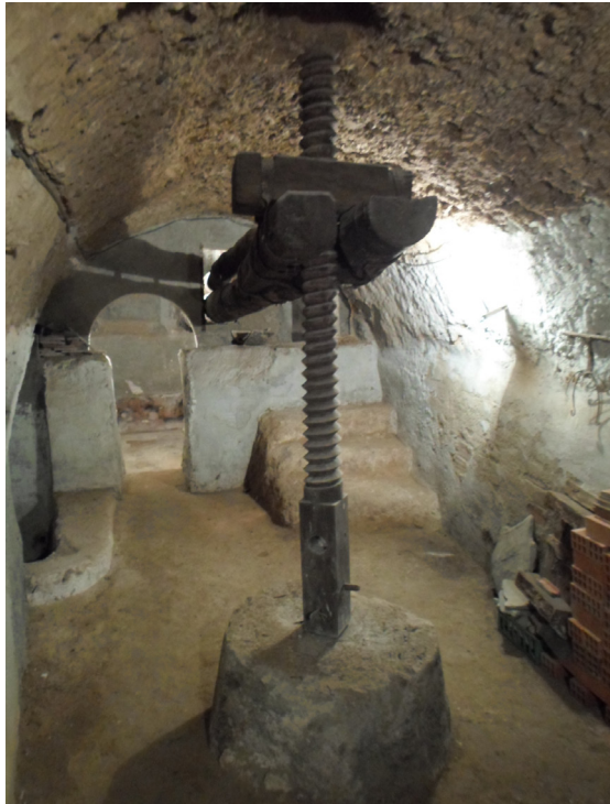
Fig. 7. Lagar tradicional en el interior de la bodega, con la prensa de viga y usillo y el contrapeso de piedra. Torquemada.