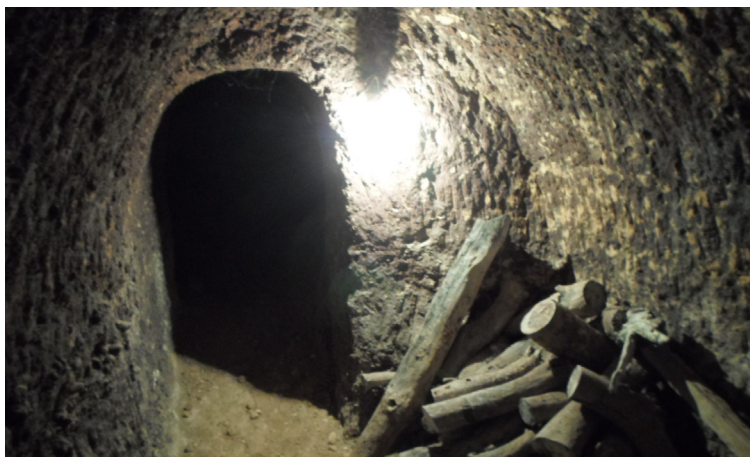
Fig. 3. Torquemada. Interior de una bodega. Nave con la marca de las picotadas del pico en su proceso de excavación

A efectos de su protección BIC como Conjunto Etnológico, se define como bodega: el conjunto de infraestructuras que integran la red de galerías así como sus accesos y las dependencias relacionadas -lagares, naves - junto con los elementos auxiliares como, zarceras, sumideros, descargaderos o lagaretas, respiraderos, etc.