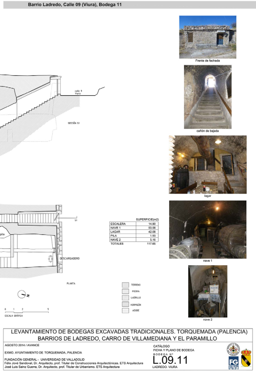
Fig. 9. Plano con sección constructiva de bodega. Ficha Bodega (L.09.11) Barrio de Ladredo, calle Viura, bodega nº 11. Se observan el pozo y el lagar en una situación intermedia del cañón de bajada, unos peldaños más abajo la nave para el curado del vino. En la sección; la escalera de bajada, las chimeneas, la bóveda excavada y el recrado de "la culata" por encima de la bodega donde se recoge la tierra procedente de la excavación.