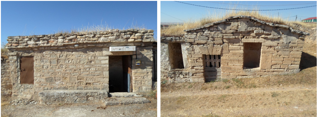
Fig. 1a /1b. Torquemada. Frente exterior de bodega construido de mampostería de piedra. Dos tipologías: remate de muro recto o en frontón quebrado. En ambos casos se observa la puerta de entrada y el descargadero desde el que se vertía la uva al lagar interior.

tiempo que crecía la producción y venta de vino. En 1739 el municipio vendía vino al por mayor a “taberneros y trajineros y carros leoneses, montañeses, maragatos y otros sacadores” (AHN) y en 1850 Madoz nos dice que Torquemada “exportaba grandes cantidades de vino a Reinosa y Santander”. Esta actividad se mantuvo hasta bien entrado el siglo XX hasta la llegada de la concentración parcelaria que promovió el arranque del viñedo. Actualmente existe una bodega productiva que, con métodos tradicionales, produce excelentes vinos.