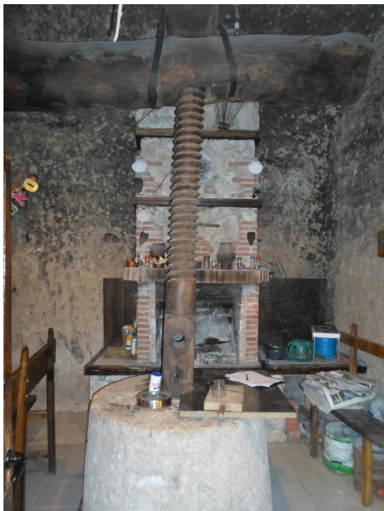
Fig. 8. Lagar convertido en merendero. Se mantiene íntegra la prensa. La echadera ha sido convertida en parrilla con chimenea. Torquemada.