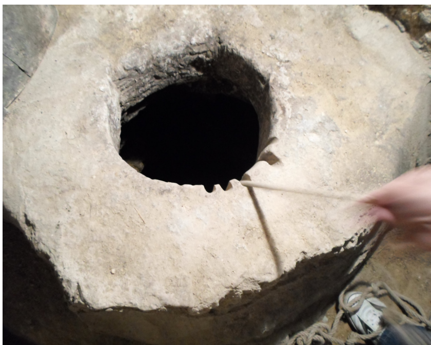
Fig. 6a /6b. Pozo en el interior de una bodega. Torquemada. Se observan en 6b las marcas dejadas en el brocal de piedra del pozo, por la soga de la que cuelga el cubo...en un subir y bajar de siglos.