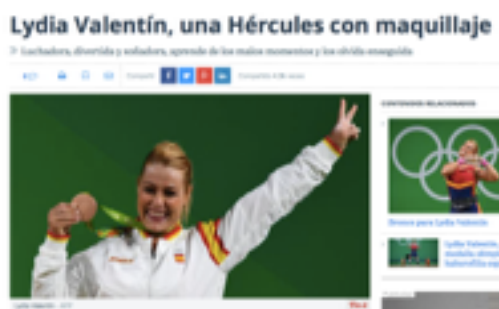
Imagen 3. Perfil de la halterófila Lydia Valentín publicado por ABC .