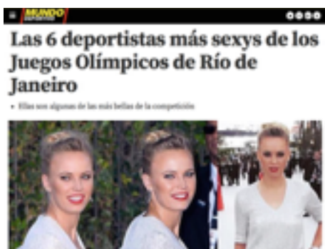
Imagen 2. Artículo publicado por el diario Mundo Deportivo durante los Juegos Olímpicos.