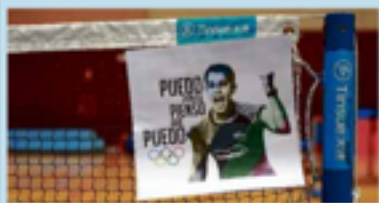
Los cartiles que hay en la pista del CARR de Madrid