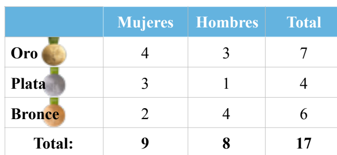
Tabla 4. Clasificación de las medallas obtenidas por metales y género.