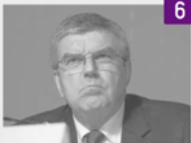
Thomas Bach, presidente del Comité Olímpico Internacional.