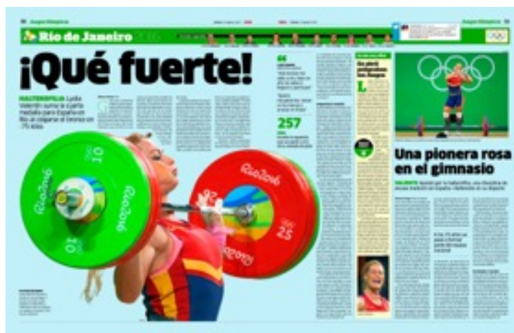
Imagen 8. Doble página dedicada a la medalla de bronce conseguida por Lydia Valentín.