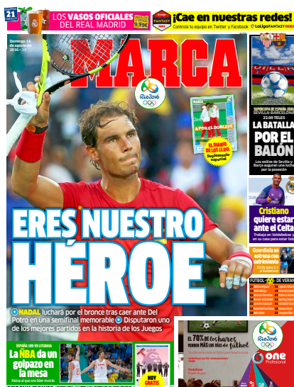
Imagen 18. Titular “Eres nuestro héroe” de Marca dedicado a Rafa Nadal tras haber perdido la semifinal de tenis individual.

En 84 de las 218 unidades informativas analizadas se han hallado rasgos sensacionalistas, un dato que pone de manifiesto el amarillismo de ambas cabeceras y su tendencia a resaltar aspectos extradeportivos además de exaltar las “gestas” de algunos de los deportistas a los que se idolatra (Imagen 18).