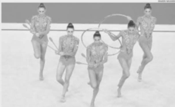
El equipo de gimnasia rítmica español luchará por las medallas en la final, tras firmar la mejor nota.