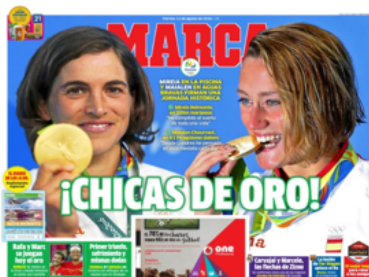
Imagen 16. Designación de las mujeres medallistas por “chicas”.

Tal y como explicábamos en el marco teórico de este estudio, designar a las mujeres como chicas, sea cual sea el deporte, la edad o la categoría, conduce a su infravaloración. Durante el trabajo de campo, encontramos ejemplos como “Chicas de oro” o “Las chicas de rítmica se llevaron la plata”. Un efecto similar se produce cuando estas son designadas por su nombre de pila, una tendencia de la que también hallamos más de una treintena de ejemplos tan solo en el titular de las unidades informativas. Véase “Mireia, bronce; Fátima, casi”.