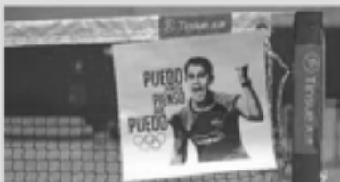
Los cartiles que hay en la pista del CAR de Madrid