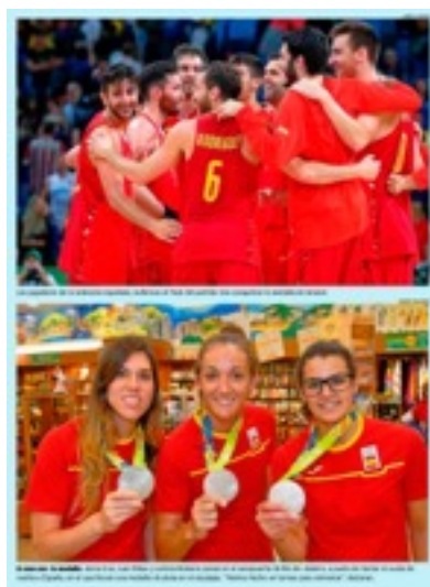
Imagen 17. La selección masculina de baloncesto festeja la medalla de bronce sobre la cancha. Más abajo, tres integrantes de la selección femenina lo celebran posando con la medalla de plata.

De las 215 imágenes analizadas, las cuales ninguna fue realizada por una mujer de forma expresa, encontramos singulares diferencias entre las actitudes de sus protagonistas. Así, las mujeres aparecen en un 48% de ellas posando para la fotografía (habitualmente mordiendo la medalla olímpica, gesto acostumbrado entre los vencedores), en tanto que los hombres aparecen festejando el triunfo (normalmente con el puño en alto en una expresión que transmite fuerza), dos actitudes resumidas y plasmadas en una misma página (Imagen 17).