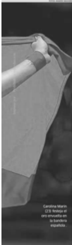
Carolina Marín (23) festeja el oro envuelta en la bandera española.