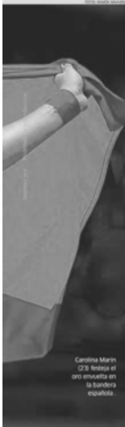
Carolina Marín (23) levanta el oro envuelta en la bandera española.