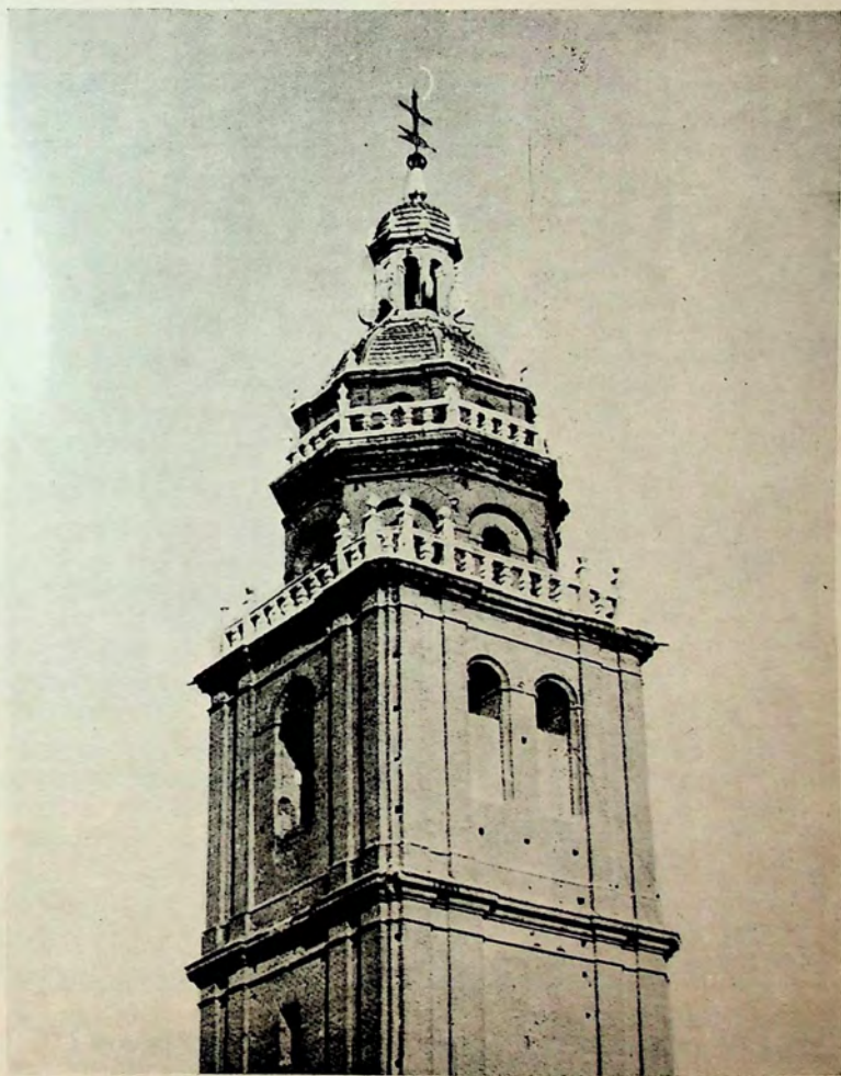
MATAPOZUELOS. Iglesia de la Magdalena. Torre.