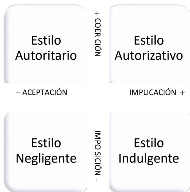
Figura 1. Estilos de Socialización Nota: Fuente: Musitu (2015, p.44).

Por otra parte, Darling y Steinberg (1994, p.488) hacen referencia a otros estilos educativos familiares, aportando otra visión del rendimiento académico de los niños en la escuela según la función que tengan y su grado de implicación ante los niños. De este modo según Dornbusch, Ritter, Leiderman, Roberts y Frailegh (1987) descubrieron que los niños cuyos padres eran negligentes o permisivos presentaban unas calificaciones bajas, mientras que aquellos niños que pertenecían a un estilo más autoritativo o autoritario tenían unas calificaciones más altas. Destacando que la participación en clase de los niños con ayudas voluntarias de los padres aumentaba las expectativas de los propio alumnos.