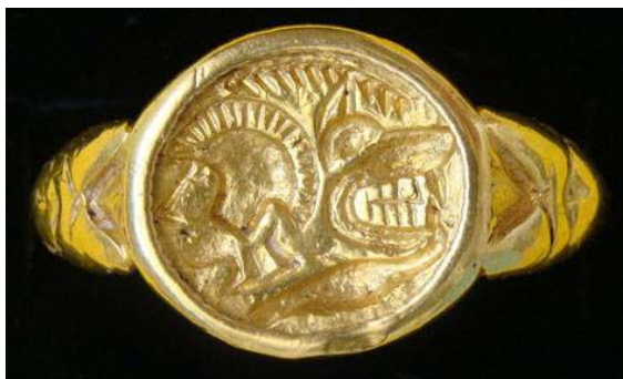
Fig. 5. Cabeza de ‘hombre-lobo’, devorando un ánade o ave solar, en el anillo áureo de Alcubillas, Ciudad Real 2 .

A este mismo mito, tal ampliamente atestiguado en la Europa indoeuropea, es al que deben hacer referencia las representaciones celtibéricas y vacceas comentadas de los siglos III al I a.C., entre las que se incluye esta tésera de useitios, que evidencian la amplia difusión que también tuvo este relato mítico por la Hispania Celtica , siempre con variantes adaptadas a las distintas áreas y a su evolución temporal.