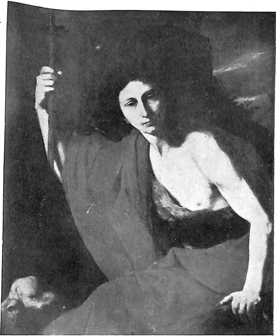
Lám. I.—Ribera? San Juan Bautista. Col. Alvarez de Toledo. Valladolid.