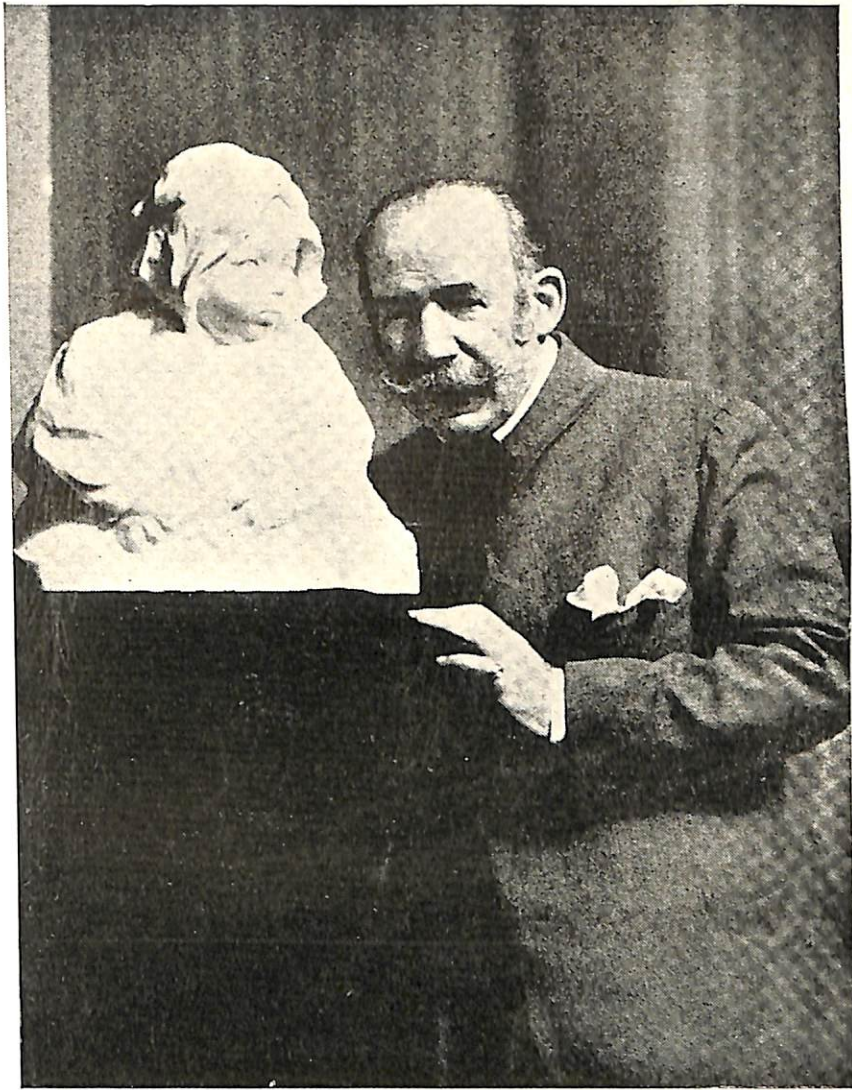
Lám. I.—Mariano Benlliure.