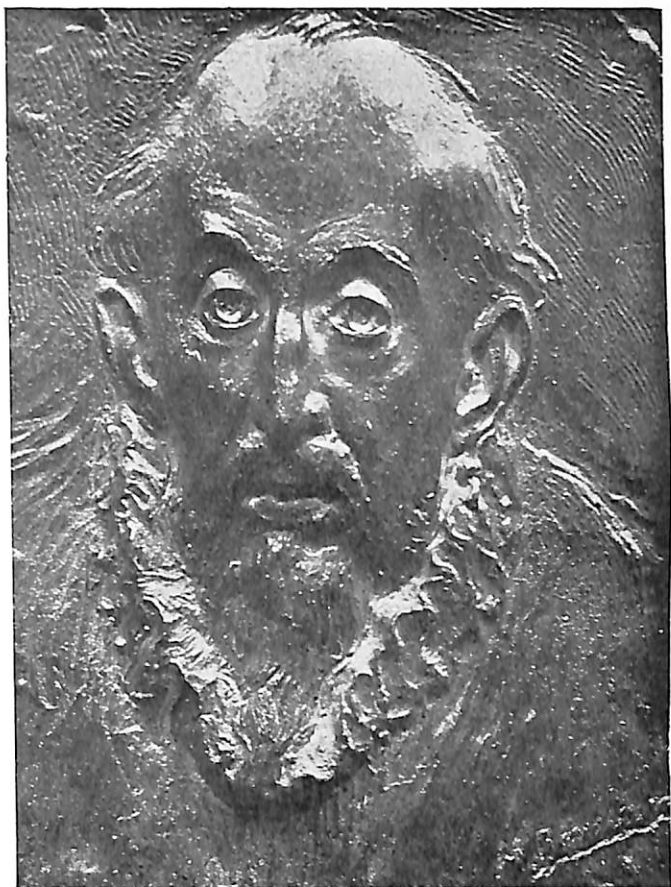
Lám. III.—Mariano Benlliure. Cabeza del Greco. Del monumento erigido en Fódele (Creta), por la Facultad de Historia de Valladolid.