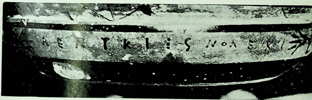
LÁMINA I.—Vaso conservado en el Museo Cerralbo.