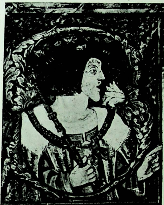
LÁMINA I.—Retrato juvenil de Carlos V, que figura en una carta de privilegio por él otorgado y relativa a la venta del pescado en Valladolid.