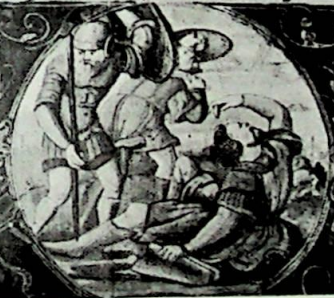
LÁMINA II. - Carlos V confirma ciertas ordenanzas vallisoletanas.

de lamarra de granada de toledo de valencia de galizia de alaloras de semilla de cerdeña de cordoba de corcega de anducia de jaen de los algarbes de algezira de gibraltar de las islas de canaria y de las yndias islas e tierra firme del mar oceano condes de Barcelona señores de vizcaya e de molina duques de athenas e de neopatria condes de Rusellion e de cerdania marqueses de Oristan e de gozia no arelbi duques de austria duques de borgonia e de bra vante condes de flandres e de ntrol e y por quanto por parte de vos el condeio susseia Regidores de la muy noble villa de Valladolid nos fue fecha relacion por vna peti cion diziendo que por la confusion que tenia de parala buena gobernacion de la villa con el gran volumen de or denanzas antiguas e muchas dellas impertinētes e no necessarias e tambien por no estar algunas por fros