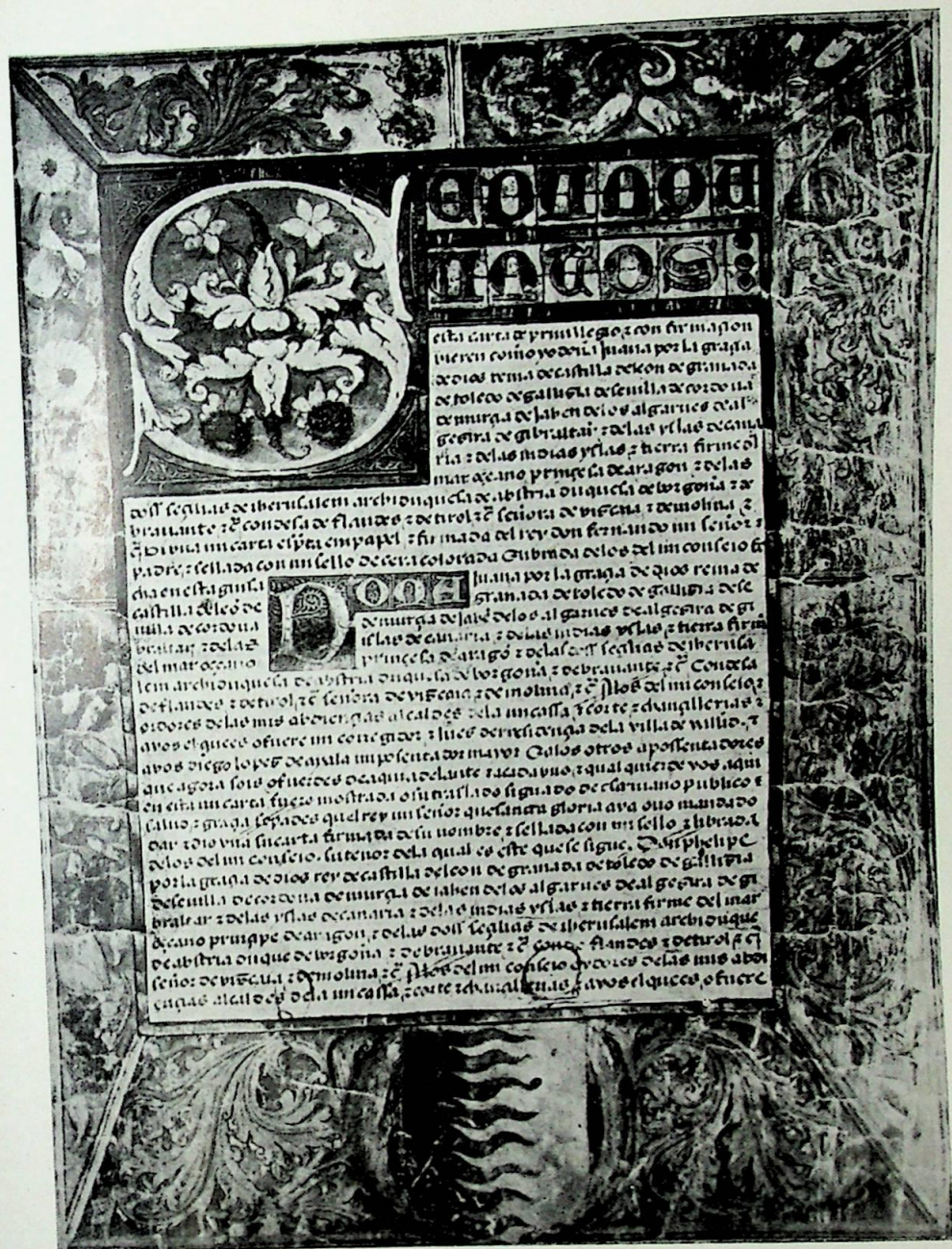
LÁMINA IV.—Carta de Felipe II sobre exención de huéspedes.