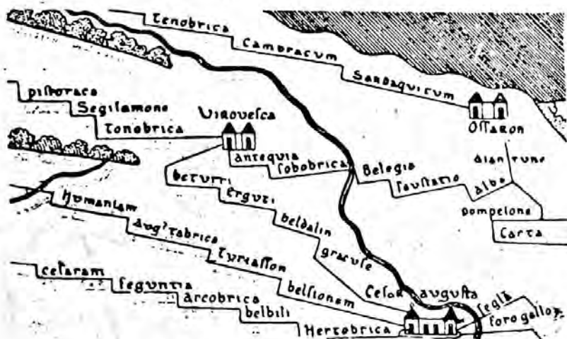
Itinerario de las vías romanas que pasaban por Virouesca. (Según la Tabula Peutingeriana restituída por Konrad Müller).

allá de los hallazgos realizados aunque sin una exploración sistemática. Se nos han conservado: atalayas, cfr. Hergueta Noticias históricas de la ciudad de Haro , pág. 33; sarcófagos, cfr. Blas Taracena en El Castellano , de abril de 1903, y Huidobro Boletín de la Sociedad Castellana de Excursiones , Valladolid, VII, 1915-16; monedas, cfr. Delgado Medallas autónomas de España , LII, pág. 427, y Cean Antigüedades romanas , pág. 167;