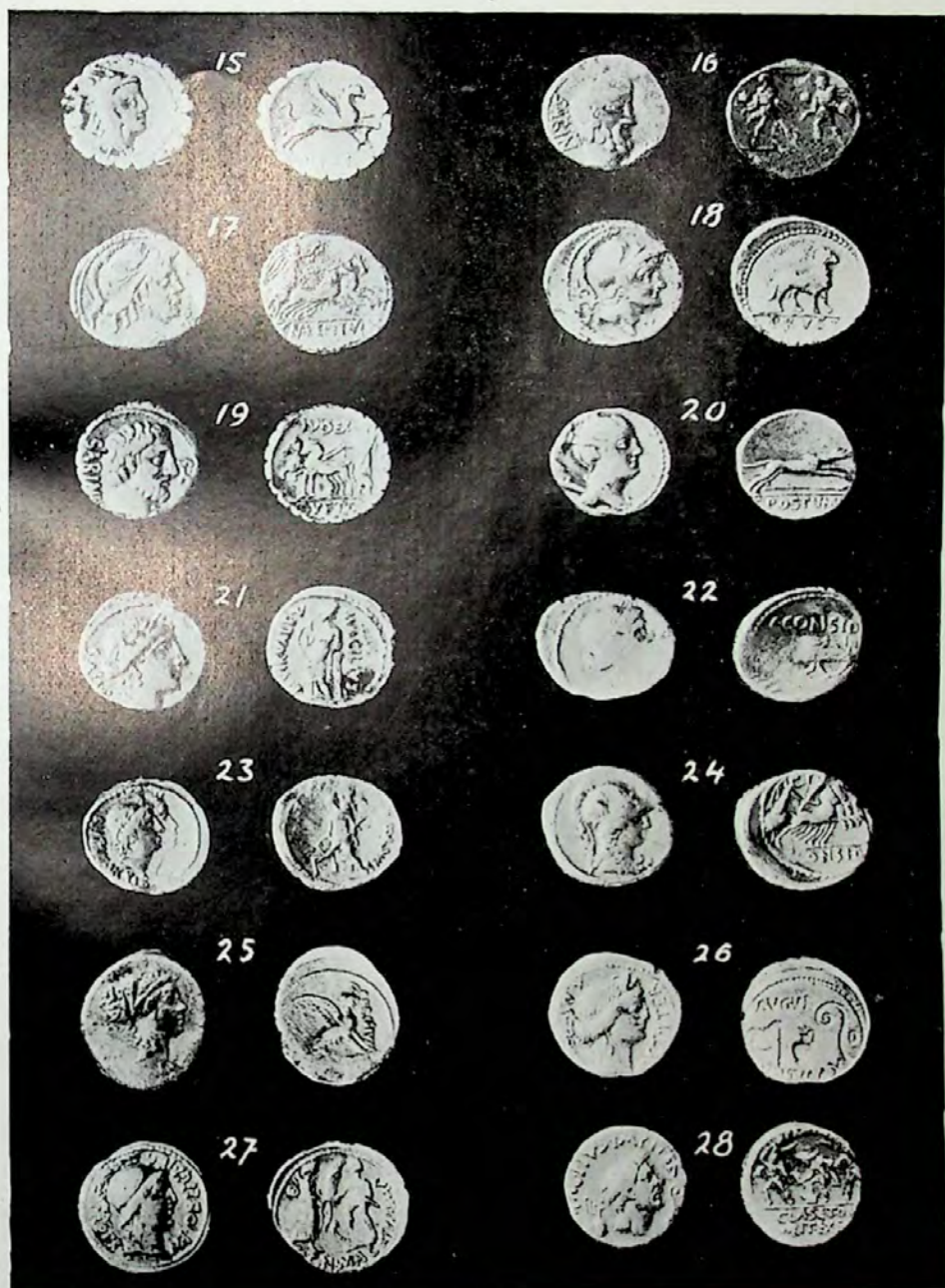
LÁMINA II.—Del Tesorillo de Abertura.