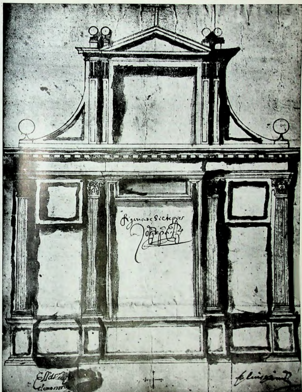
LÁMINA I. Nava del Rey. Traza del retablo de San Antón por Juan de Muniategui. 1608.