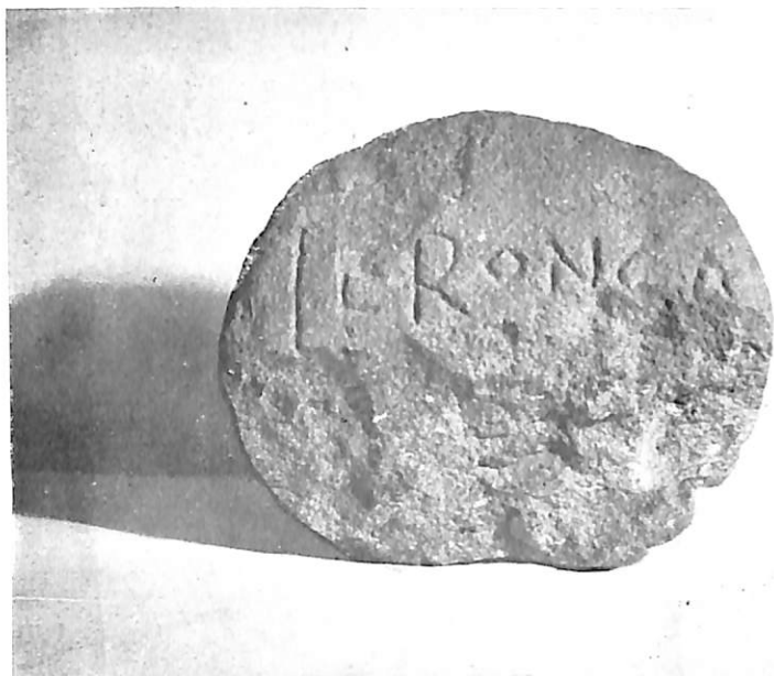
Estela de Espinilla (Santander). Anverso.