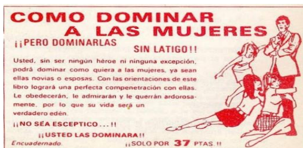
Imagen 3: (2015). atravesdeluniberto.blogspot.com.es . Recuperado el 21 de mayo de 2018, de http://atravesdeluniberto.blogspot.com.es/2015/08/como-dominar-las-mujeres-pero-sin-latigo.html

Aunque nos separan más de cincuenta años de esta imagen, su visión produce una honda impresión en el espectador actual. No es de extrañar. El anuncio muestra claramente el poco respeto con el que es tratada la mujer por parte del hombre, y la define como un ser inferior y sometido a la libre voluntad del hombre. En este caso se subraya este dato con el mensaje incluido en el anuncio de que “es bonito tener una chica en la casa”. Es una cruel forma de cosificar a la mujer (una chica) frente al hombre (el hombre).