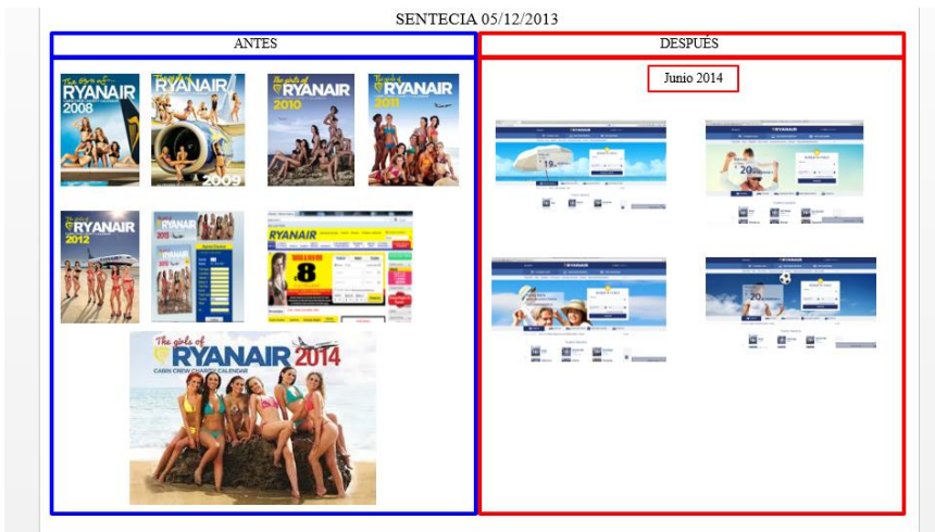
Imagen 6:

El tercer asunto se refiere a la empresa Cementos la Unión, SA . El Instituto de la Mujer de Madrid denuncia a esta empresa en octubre de 2014 por utilizar, en su página web, una publicidad que considera ilícita y desleal.