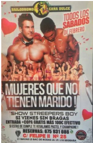
Imagen 4:

Éste es, sin duda, uno de los carteles más denigrantes, humillantes y vergonzosos hacia la mujer que podemos encontrar a día de hoy. Es verdad que no es inhabitual encontrar en las discotecas diferentes ofertas de entrada dirigidas únicamente a la mujer, ya que se la utiliza como objeto con el fin de llamar la atención de los hombres. A tener un alto nivel de asistencia del colectivo femenino debido a la oferta, asisten mayor número de hombres y, finalmente, se venden en total muchas más entradas. Sin embargo, vemos como esta discoteca va muchísimo más allá, ridiculizando a la mujer y tratándola como objeto de reclamo hasta unos niveles realmente insólitos.