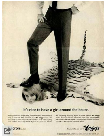
Imagen 2:

Si este anuncio se considera desafortunado, mucho más lo es, sin ningún género de dudas, el ofrecido por la marcas Leggs en 1960, en el que se muestra a una mujer a la altura de los zapatos del hombre, que está siendo pisoteada por éste, y en la que la fémina asume, además, una posición sumisa, sin oponer ningún tipo de resistencia.