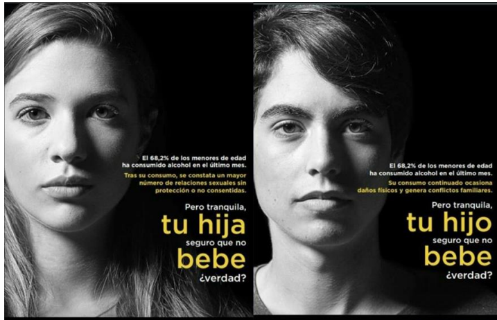
Imagen 1:

Tras el lanzamiento de esta campaña de prevención, FACUA 16 denunció ya que tras la lectura del mensaje, se podía llegar a entender que las violaciones eran producto del alcohol, restándoles culpa a los hombres que la realizan y sumándosela a las mujeres por haber consumido.