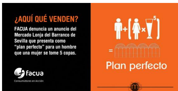
Imagen 6: (2016). huffingtonpost.es. Recuperado el 21 de Mayo de 2018, de

Cerramos este apartado con un breve análisis del anuncio del Mercado Lonja del Barranco (Sevilla) puesto en circulación en el año 2015. Una vez más, es esta mismo colectivo quien denuncia que la gráfica utilizada resulta machista.