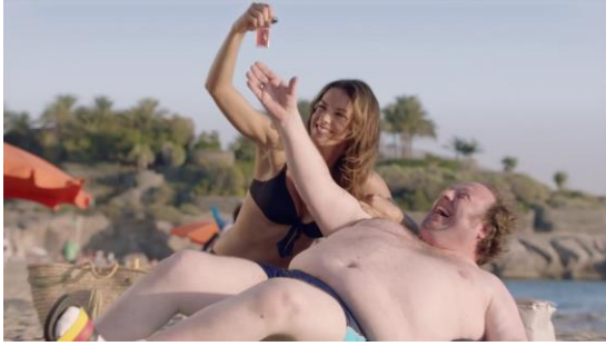
Imagen 5: