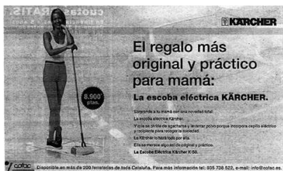
Imagen 4: (2010). cambiosocialygenero.blogspot.com.es . Recuperado el 21 de mayo de 2018, de http://cambiosocialygenero.blogspot.com.es/2010/10/anuncio-sexista.html

Este libro no es la causa del problema, sino una privilegiada manifestación de la secular discriminación que la mujer ha sufrido en nuestro país hasta fechas relativamente recientes. Su utilidad es que evidencia, con toda su crudeza, este problema. Y conviene recordar que aún hoy se pueden encontrar por internet publicaciones que tratan de aleccionar a hombres a dominar y seducir a mujeres 12 . Lo que ocurre es que lo que era normal hace lustros hoy debe merecer una seria crítica.