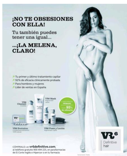
Imagen 5: (2016). europapress.es. Consultado el 21 de Mayo de 2018, de http://www.europapress.es/epsocial/noticia-empresa-denunciada-facua-niega-sexismo-campana-20160510154712.html

En la gráfica utilizada podía verse a la derecha la imagen de una mujer desnuda, tapándose el pecho con un brazo, y el pubis con la otra mano y una toalla. En el lado izquierdo, podía leerse el siguiente mensaje: “¡No te obsesiones con ella! Tú también puedes tener una igual... ¡LA MELENA, CLARO!”.