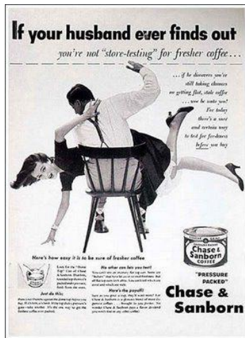
Imagen 1:

En la introducción de este trabajo hicimos una referencia al spot televisivo del coñac Soberano . Centraremos ahora nuestra mirada en algunas imágenes gráficas que aportan un estereotipo de la mujer que hoy resulta imposible defender en público 11 . El interés de esta publicidad es que se atiene a modelos socialmente imperantes cuando fueron elaborados. Lo que entonces era normal hoy resulta inaceptable y socialmente reprochable.