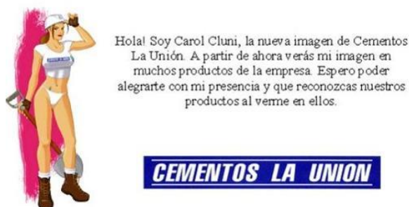
Imagen 8: (2016). abc.es. Recuperado el 21 de Mayo de 2018, de http://www.abc.es/espana/comunidad-valenciana/abci-juez-obliga-retirar-campana-publicitaria-anunciaba-cemento-chicas-ligeras-ropa-201610221226_noticia.html

A este personaje publicitario se le pone el nombre de “Carol Cluni” y forma parte de la identidad visual de la empresa. Se utilizaba el mismo para la promoción de sus productos, y se indica que espera poder alegrarte con su existencia.