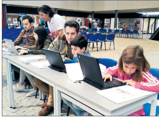
Imagen de archivo de una edición anterior del Scratch Day en el complejo universitario de Segovia.

El I Campus Tecnológico de verano 'María Zambrano' aprovecha la época estival para desarrollar competencias tecnológicas y profundizar en el inglés o las matemáticas, siempre a través del juego y el divertimento. Se desarrollarán sesiones con expertos de disciplinas científico- tecnológicas y elaborarán proyectos relacionados con la programación de videojuegos y aplicaciones, la robótica, la impresión 3D, experimentos científicos, electrónica, realidad virtual, elaboración de vídeo, etc. Además, por la combinación con las clases de inglés o de matemáticas recreativas, los participantes se acercan a la disciplina elegida con un enfoque menos académico que durante el curso, trabajando con ellos desde el gusto por la materia. El campus está dirigido a estudiantes de entre los 6 y los 16 años con afición por la ciencia y la tecnología.