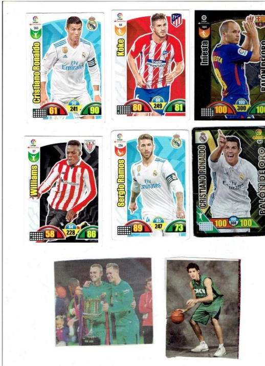
Ilustración 2. Ejemplos de imágenes de actividad 1