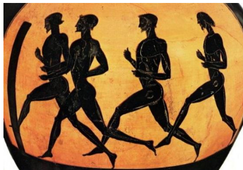
Figura 1. Atletas en los Juegos Olímpicos en la Grecia Antigua

Los Juegos Olímpicos de la antigüedad, los antiguos Festivales Religiosos de Olimpia, se llevaron a cabo entre el 776 a.C y el 392 d.C. Estos juegos se celebraban cada cuatro años y tenía lugar en la ciudad griega de Olimpia. Además, la participación en estos juegos estaba restringida a los hombres (Lacámara Bustamante, 2015). Asimismo, según García Ferrando (1990), en los Juegos Olímpicos de la sociedad griega, las diosas, como representantes de la mujer, se asociaban a cualidades como la belleza, la sexualidad y la pasividad. Por su parte, los dioses, como representantes del hombre, mostraban cualidades como la actividad, el vigor y la fuerza. Como consecuencia, la presencia femenina en esta festividad deportiva era mínima.