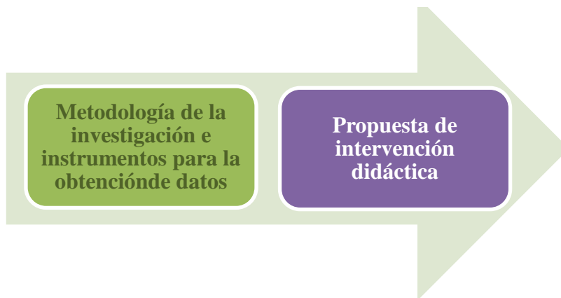
Figura 2. Sub-apartados de metodología de investigación y diseño de la propuesta de intervención

Este apartado se divide en dos grandes sub-apartados: en el primero de ellos, se muestran las principales características de la metodología cualitativa utilizada en la investigación para conocer y analizar el tratamiento y rol de la mujer en el mundo del deporte y de la Educación Física dentro de una realidad educativa concreta. Asimismo, se detallan los instrumentos de obtención de datos utilizados, el análisis de los mismos y los criterios de rigor científico utilizados. En la segunda parte de la investigación, se presenta el diseño de una propuesta de intervención didáctica para el tratamiento de la coeducación en Educación Física, aplicada en un contexto educativo real.