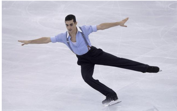
Ilustración 4. Javier Fernández, patinaje artístico