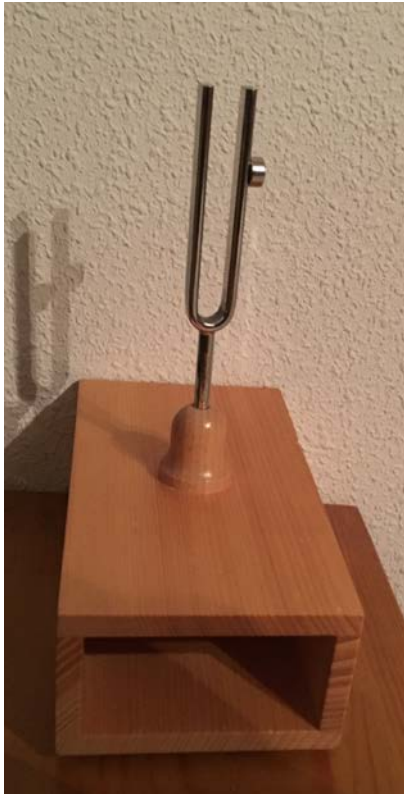
Ilustración 1 Diapasón (440 Hz) con imán para desplazar su frecuencia característica (423 Hz)

Es una actividad muy transversal que puede relacionarse con otras materias como la tecnología, fisiología y la música. Se pretende estudiar algunas de las propiedades de las ondas sonoras como son el fenómeno de la resonancia y el de la superposición de ondas (batidos). A partir de los mismos elementos e introduciendo algunos nuevos al alcance de todos. Con una probeta se podrían estudiar y determinar otras propiedades de las ondas sonoras como su velocidad. Se podría analizar la física de algunos instrumentos musicales, por ejemplo, una guitarra, proponiéndola como actividad a realizar fuera del centro a los estudiantes. Un diapasón es una pieza en forma de U de metal elástico (generalmente acero). Cuando se le golpea haciéndolo vibrar resuena en un tono específico y constante. El tono en el que resuena un diapasón depende del largo de los 2 extremos. Habitualmente el sonido producido es el La_3 o A_4 , con una frecuencia de 440 Hz. Este sonido natural fue ajustado en la Segunda Conferencia Internacional para el Diapasón, en Londres el año 1939, siendo esta nota tipo y patrón de afinación de nuestro sistema musical. La afinación es la acción de poner en tono justo los instrumentos musicales en relación con un diapasón o acordarlos bien unos con otros. Normalmente se utiliza para afinar