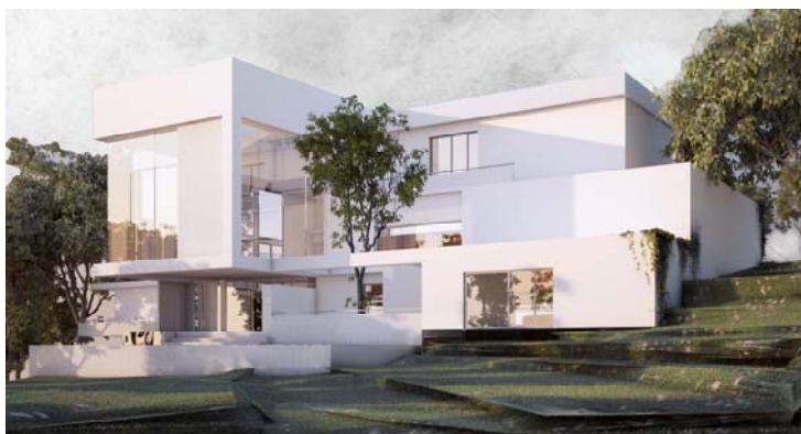
Figura 3. Ejercicio 1 de la alumna Annel Arzate Benítez. Proyectos V.

Discusión de los resultados (puntos fuertes y débiles, obstáculos encontrados, estrategias de resolución y propuesta de mejora)