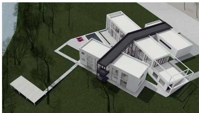
Figura 2. Ejercicio 1 de la alumna Andrea Diana Dragnescu. Proyectos V.