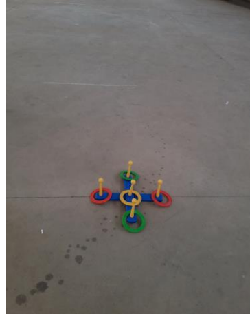
Figura 9: Ringo