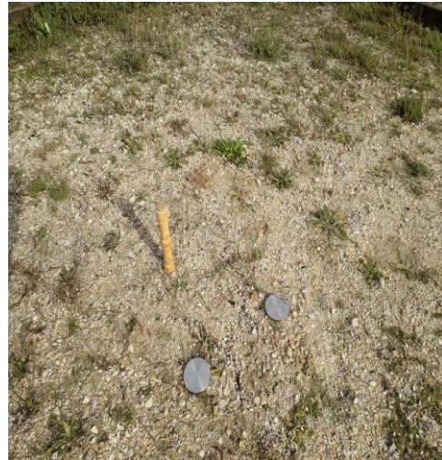
Figura 11: Tango, chito o tejo