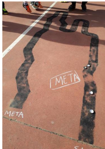
Figura 6: Meta