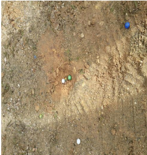
Figura 10: Canicas