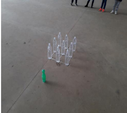
Figura 8: Bolos Valle de Tabladillo