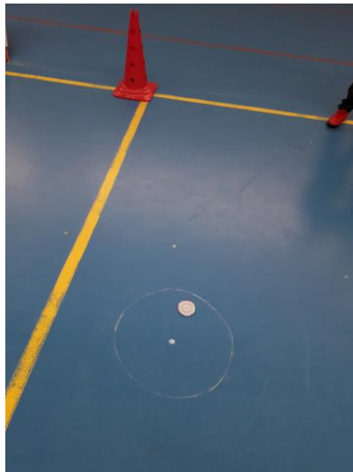
Figura 3: Los alfileres