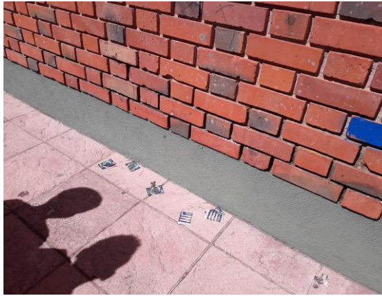
Figura 2: Raya