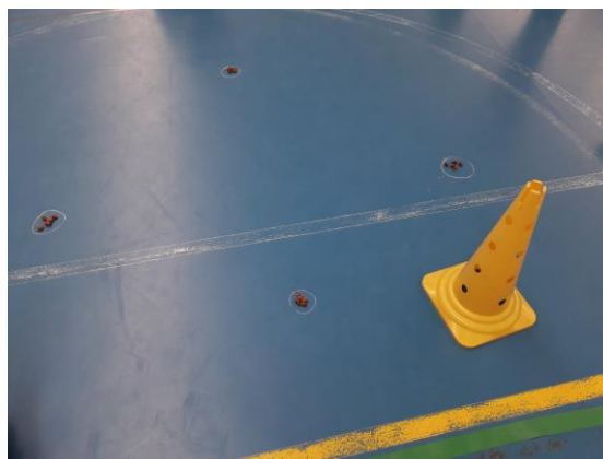
Figura 4: Las tabas