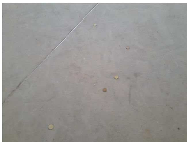
Figura 7: La osca