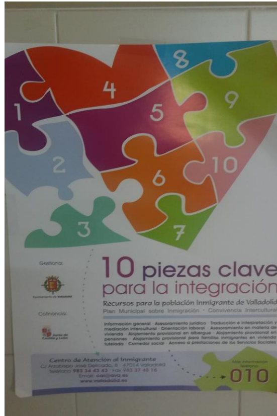
Imagen 10. Recurso para la población inmigrante “10 piezas clave para la integración”.