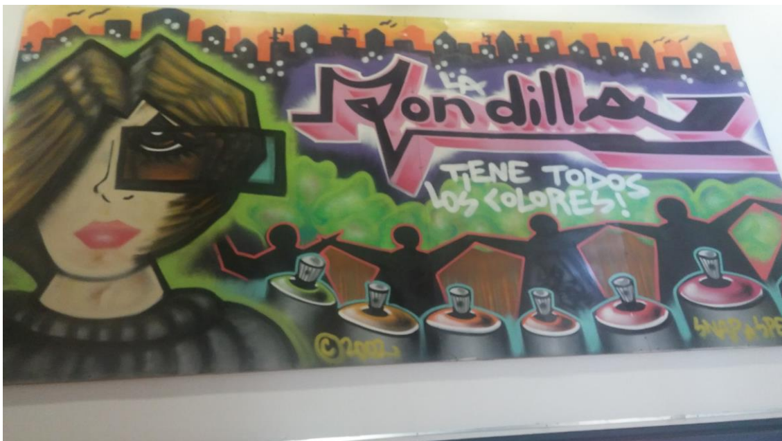
Imagen 7. Tríptico informativo “La Rondilla tiene todos los colores”.