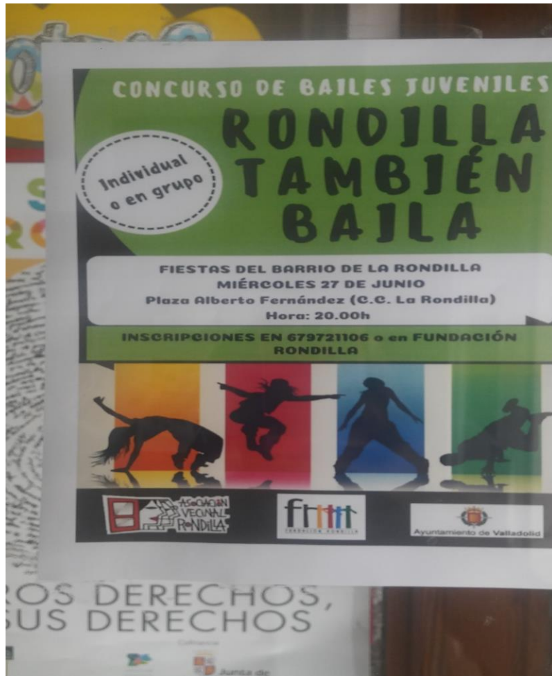
Imagen 5. Cartel publicitario “El Mundo en la Rondilla”.