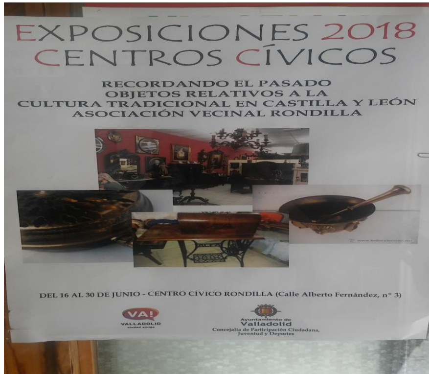
Imagen 6. Suelto publicitario “En la Rondilla cabemos todos”.