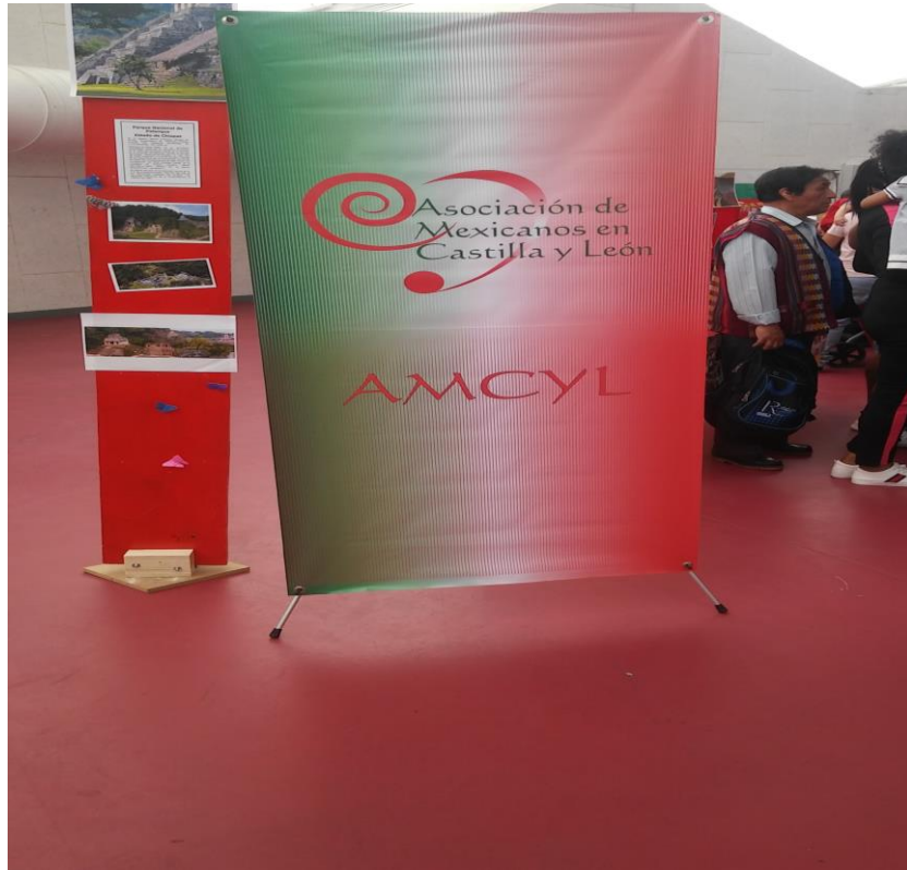
Imagen 2. Festival Intercultural en Valladolid (2018)