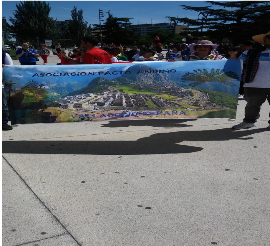
Imagen1. Festival Intercultural en Valladolid 2018