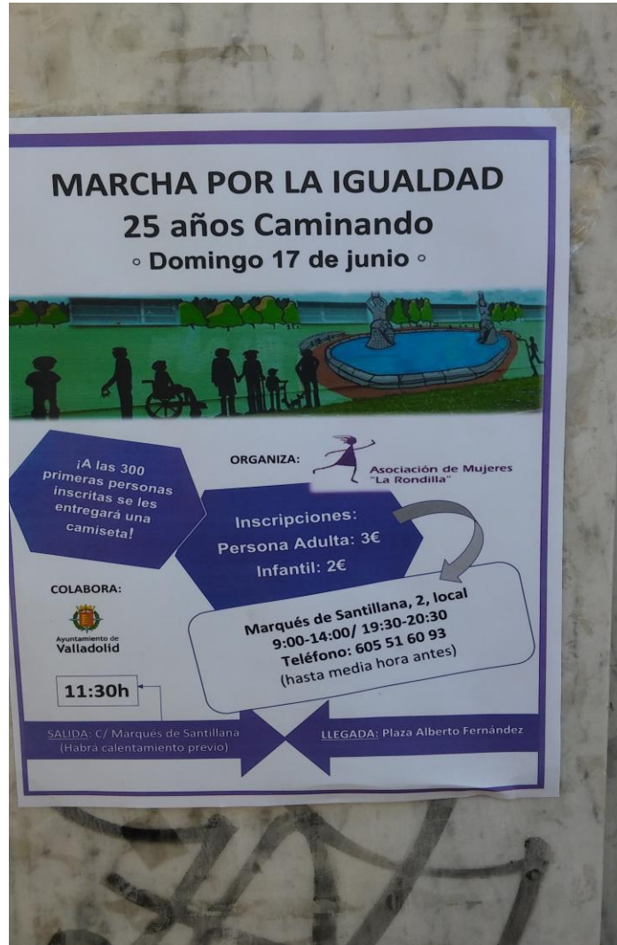
Imagen 4. Cartel- actividad en la Semana Intercultural (2018)