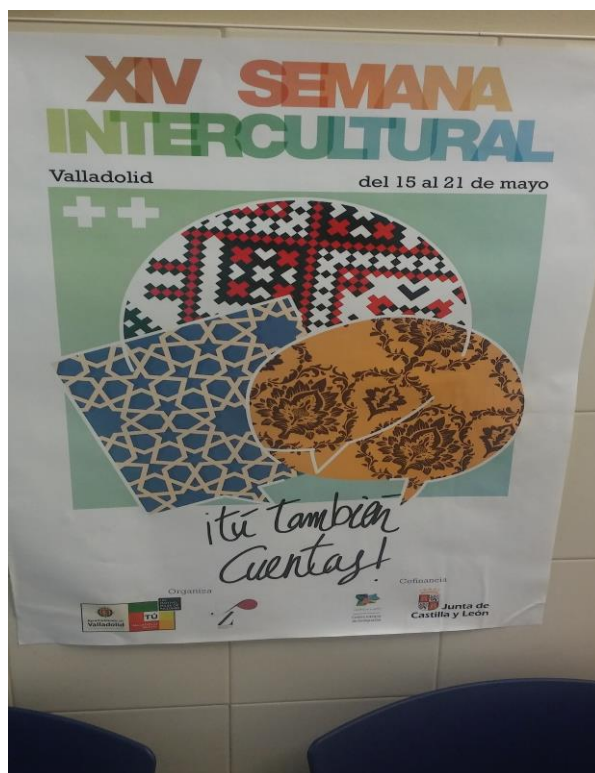
Imagen 9. Cartel por la XIV Semana Intercultural del 2017 "Tú también cuentas".