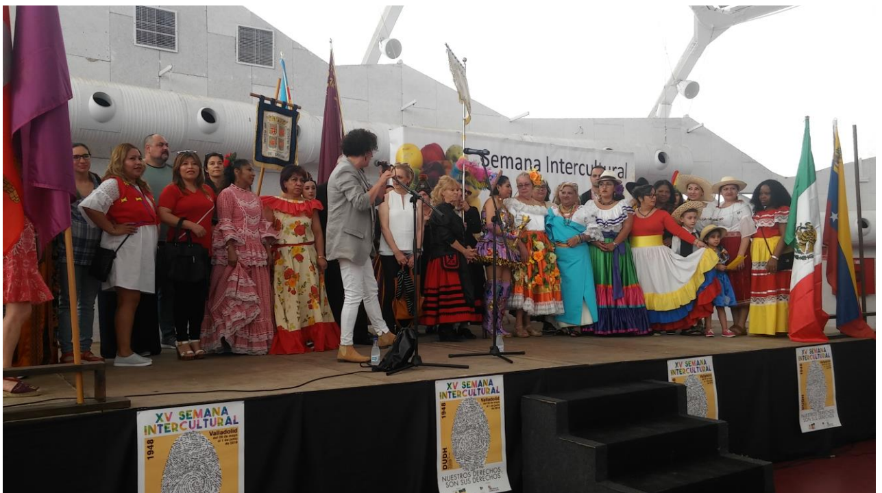
Imagen 3. Semana Intercultural en Valladolid (2018)