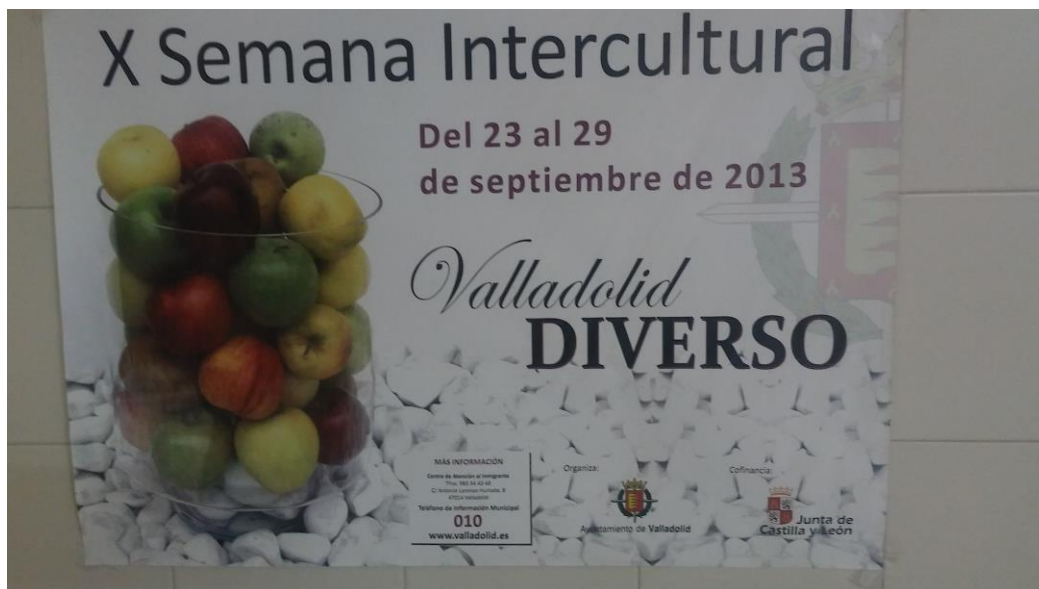
Imagen 11. Cartel por la X Semana Intercultural del 2013 “Valladolid diverso”