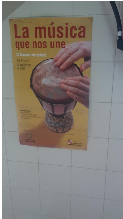
Imagen 12. Cartel por la X Semana Intercultural del 2013 “Valladolid diverso”