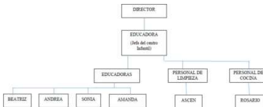
Gráfica 3: Organigrama centro infantil. Elaboración propia

Otro aspecto a tener en cuenta a la hora de realizar esta intervención, es conocer su estructura, es decir, como está formado el centro y como funciona por dentro. Por ello, se considera importante adjuntar el organigrama del centro.