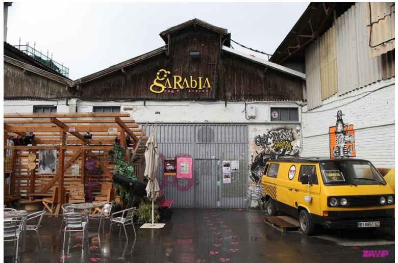
Zorrotzaurre (2017).