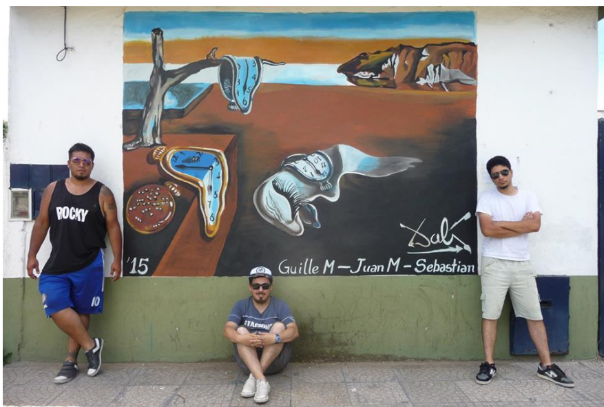
Réplica de La persistencia de la memoria de Dalí en Grand Bourg (2015).