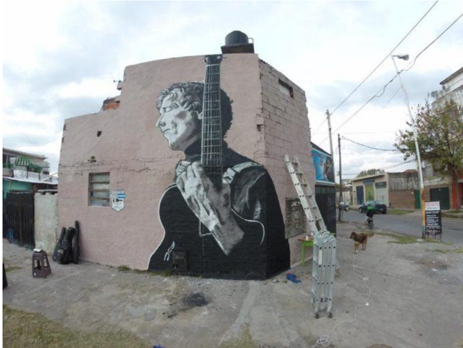
Homenaje a Luis Alberto Spinetta