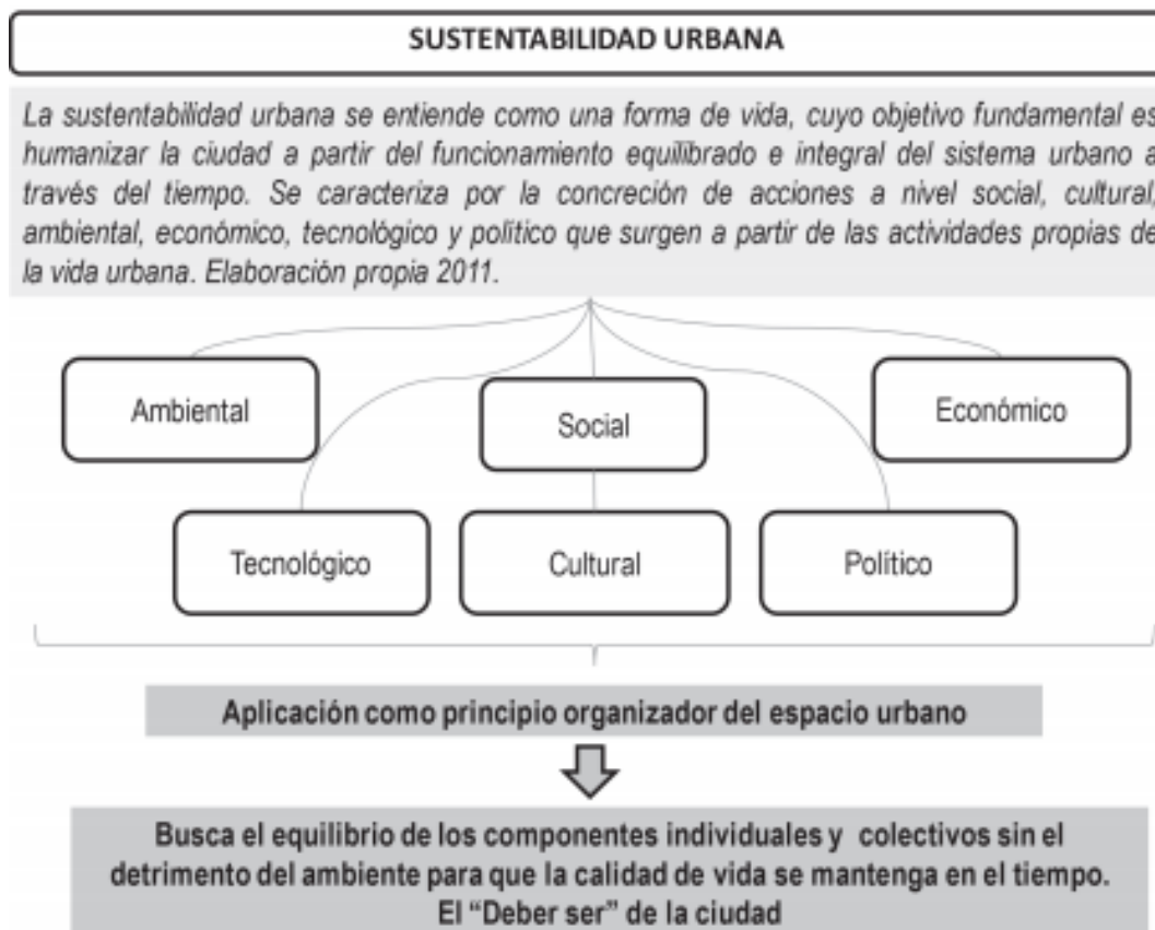
Gráfico del concepto de Sustentabilidad Urbana. Fuente: Benavides, 2011.