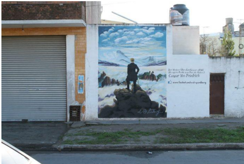
El viajero frente a un mar de nubes (Caspar Von Friedrich).