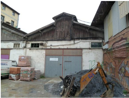
Zorrotzaurre (2011).