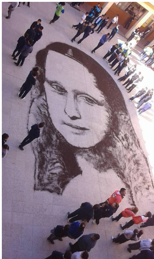
Gioconda realizada en tierra (2016). Escuela Nuestra Señora de Lourdes.

Además, con el lema Pinta tu aldea y pintarás el mundo se está llevando a cabo formación de artistas y estudiantes en Grand Bourg. Tanto es así, que en 2016 los alumnos de una escuela hicieron la obra de Da Vinci, La Gioconda , con tierra. Fue una actuación participativa y comunitaria.