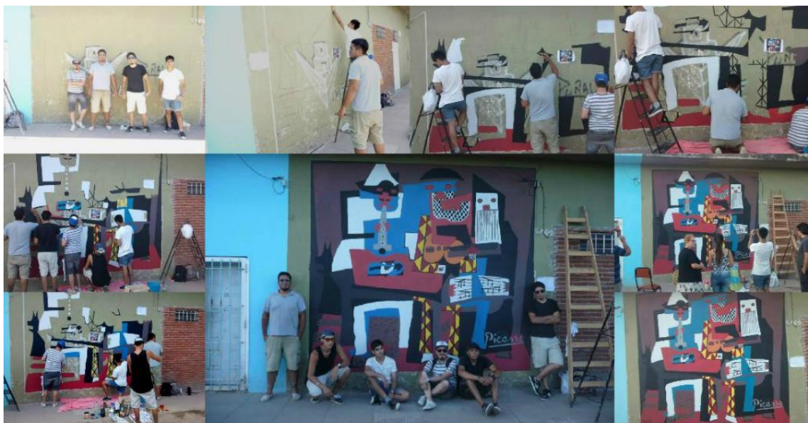
Réplica de Los Tres Músicos de Pablo Picasso en Grand Bourg (2015).

En el año 2015 se llevaron a cabo 34 murales con réplicas de obras de artistas muy conocidos, como por ejemplo Da Vinci, Dalí, Picasso, Van Gogh, Boticelli, Renoir o Monet. Un año después realizaron 25 murales de obras argentinas, y en el 2017 homenajearon a músicos argentinos como Pappo o Luis Alberto Spinetta. Sin duda comenzaron a aplicar ideas más vinculadas con su propia identidad cultural.