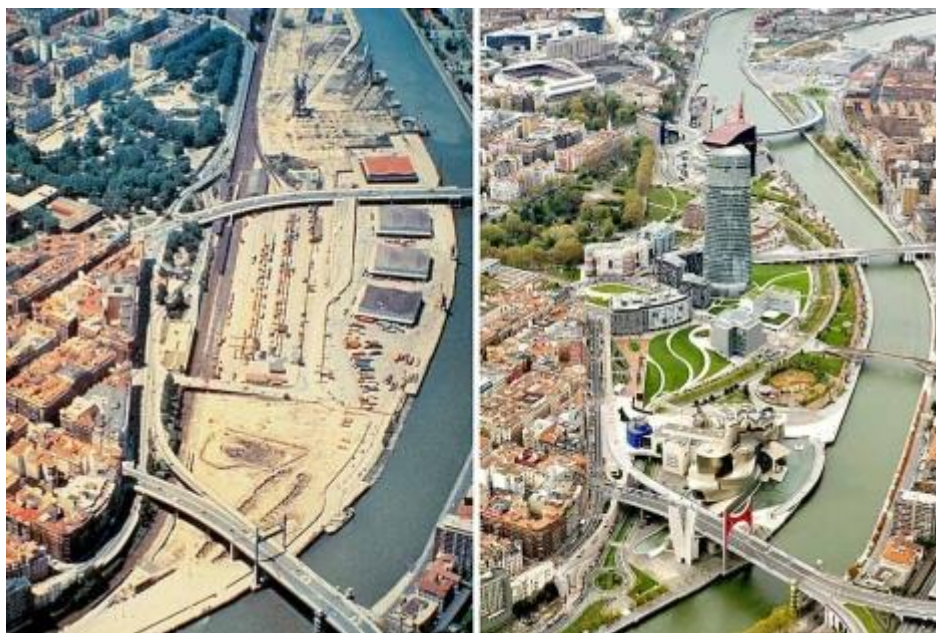
Bilbao. Abandoibarra. El antes y el después de las obras de Ría 2000.

Bilbao continúa en este proceso de transformación a través de las acciones de Bilbao Metrópoli 30 y Bilbao Ría 2000. Bilbao Ría 2000 2 se ocupa de llevar a cabo acciones en cuanto a urbanismo, transporte y medio ambiente; y Bilbao Metrópoli 30 3 tiene como objetivo recuperar y revitalizar el Bilbao Metropolitano, treinta municipios cercanos a la ría del Nervión, mediante la planificación, estudio y promoción de distintos proyectos. En realidad, este modelo de transformación es lo que se ha llamado new urban politics 4 , una manera nueva de gobernar la ciudad, y también el urbanismo empresarial (Martínez & Álvarez, 2005).