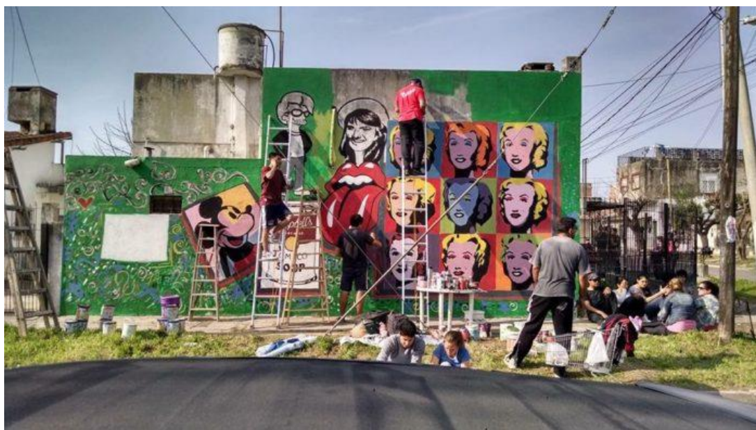
Marilyn Monroe (Andy Warhol).