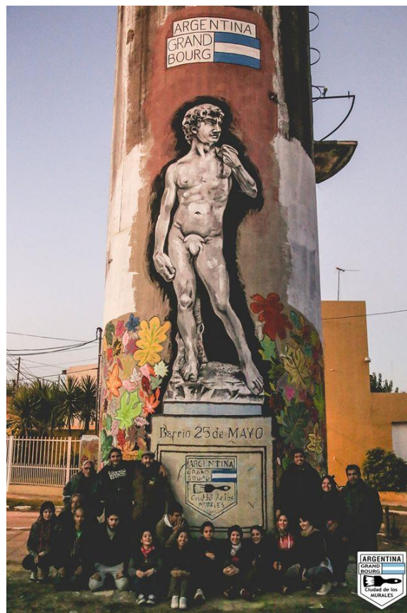
David (Miguel Ángel)