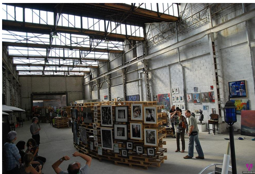
Zorrotzaurre (2010).

Este proyecto fue promovido por la Asociación de creadores/as de artes escénicas, y en él se llevan a cabo acciones en relación con el teatro o la danza. En este espacio fue inventado por los propios creadores, y lo conforman los espectadores. Se trata además de un “laboratorio” teatral de las Artes Escénicas, donde los profesionales intercambian proyectos repletos de creatividad. Se llevan a cabo cursos, clases, montajes... con el fin de superarse día a día y reconocerse a sí mismos como personas en el desarrollo de una disciplina que no se debe perder nunca.