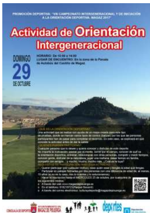
Cartel Actividad de Orientación intergeneracional 2017