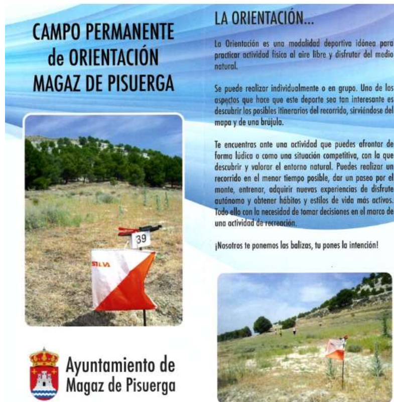
Tríptico del campo permanente de orientación en Magaz de Pisuerga.