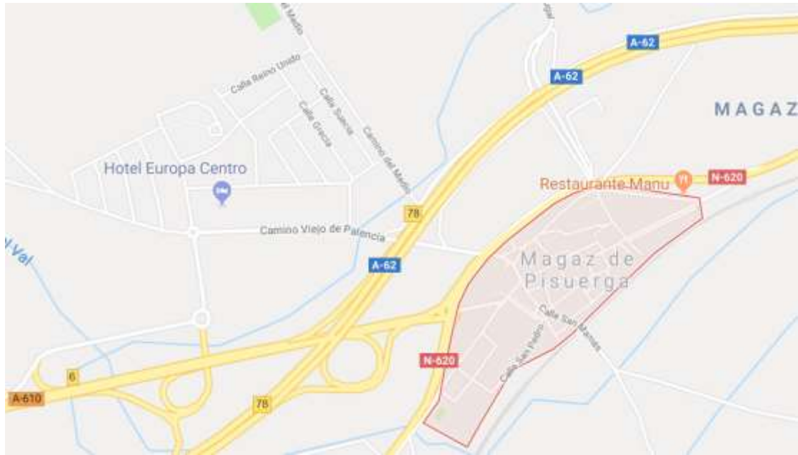
Mapa de localización de Magaz de Pisuerga