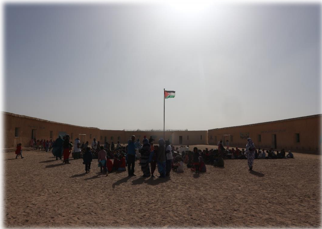
Figura 4: Escuela Walda - Auserd