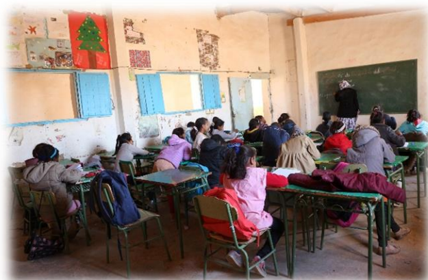
Figura 3: Clase de Primaria - Escuela Walda

El Sistema Educativo Saharaui según Moreno Fernández (2011) tiene una organización jerarquizada que tiene como fin garantizar la unidad, la coordinación y la coherencia entre todas las escuelas de las Wilayas.