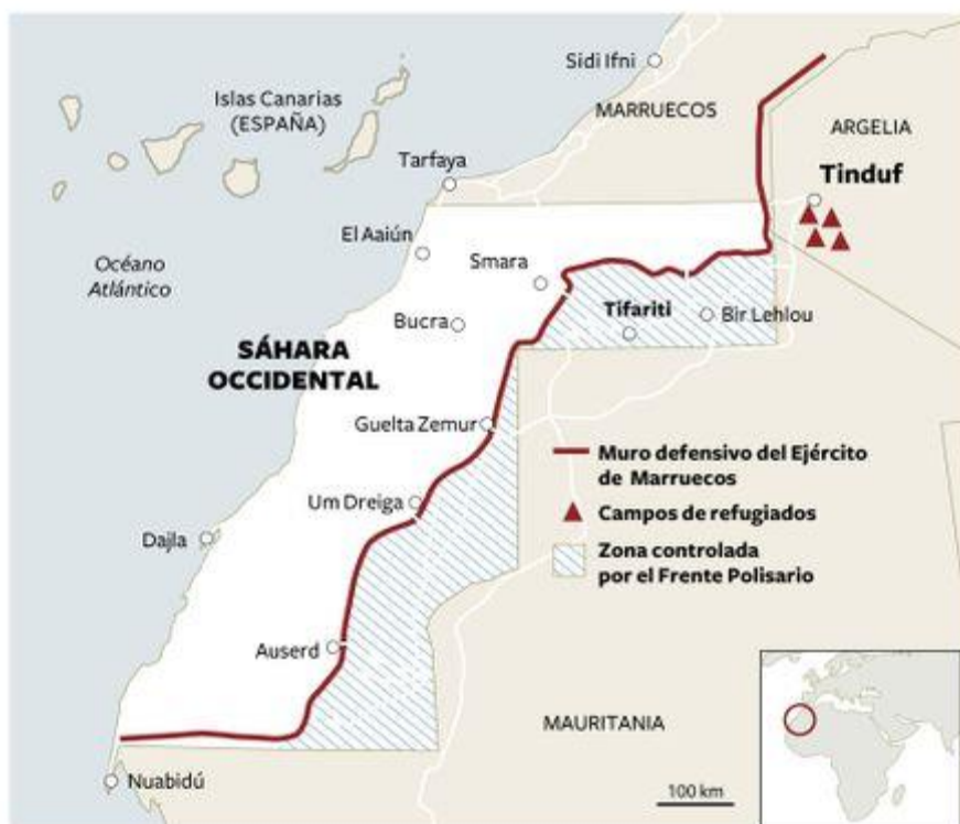
Figura 1: Situación Geográfica del Sáhara Occidental

En 1975, el ejército marroquí invadió el Sáhara Occidental por lo que miles de personas tuvieron que marcharse de sus hogares y buscar refugio para estar a salvo. Desde entonces sobreviven en la hamma de Tinduf, Argelia, auxiliados por la ayuda humanitaria internacional.